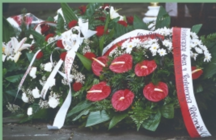
15 listopada tradycyjnie złożono hołd pamięci zamordowanych profesorów lwowskich i krakowskich uczelni. Wieniec złożyła także delegacja KRASP.