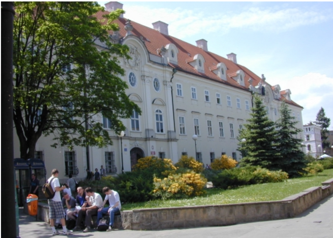
Jelenia Góra – gmach filii

Tegoroczny Festiwal Nauki w regionie, podobnie jak w poprzednich latach, odbywał się: