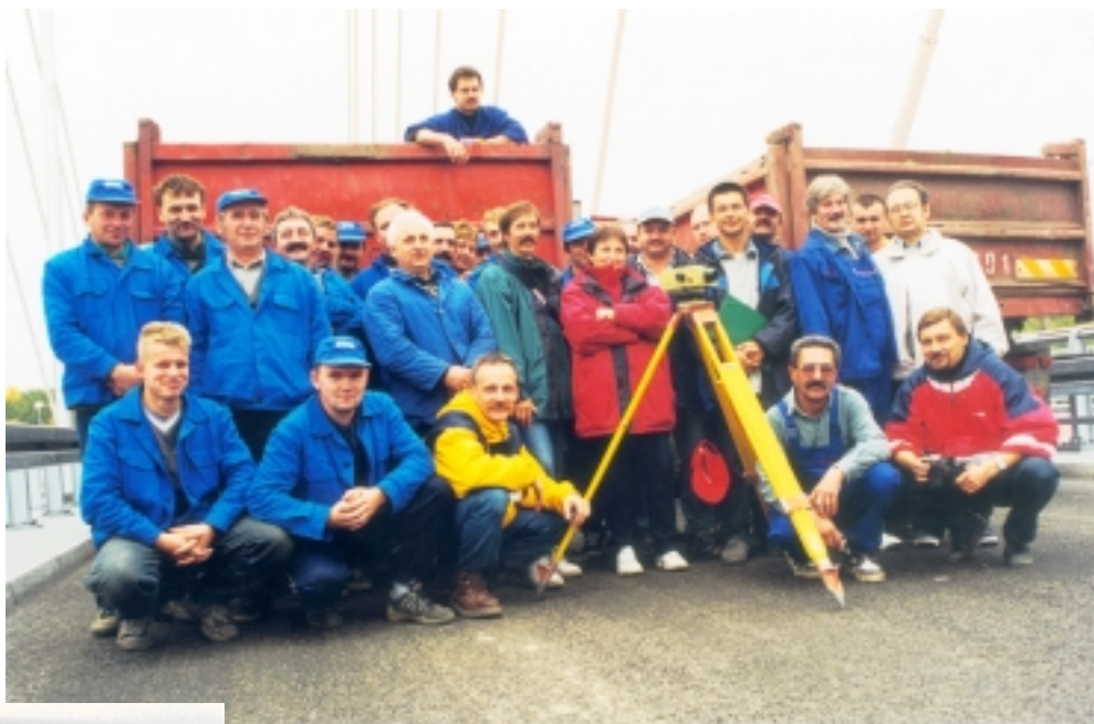
Zespół badawczy na Moście Świętokrzyskim