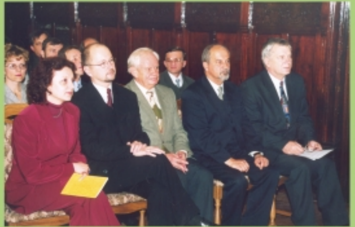
Otwarcie festiwalu w Wałbrzychu. Pierwszy z prawej prezydent miasta.