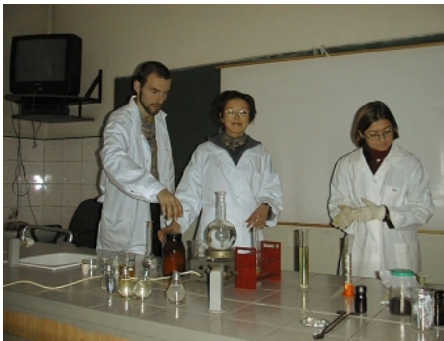
Prezentacje ALLINu w Wałbrzychu