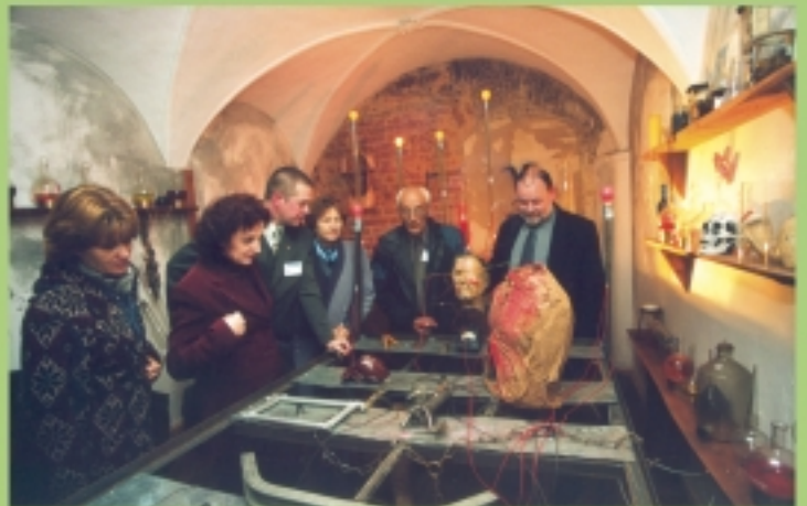
Żabkowice Śląskie. W laboratorium dr. Frankensteina.