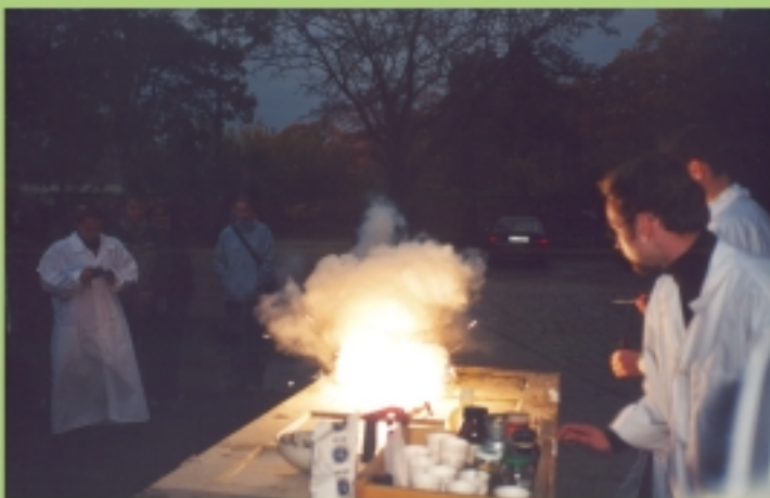
O zmroku chemicy zaczęli świecić. Koło Naukowe Alin.