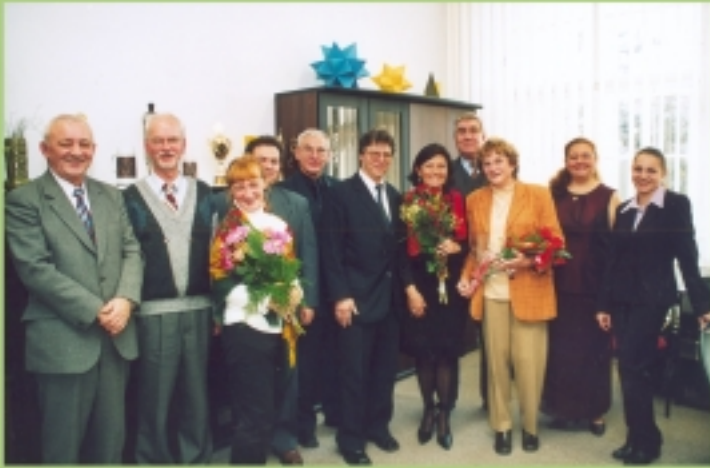
Organizatorzy i autorzy imprez festiwalowych w Legnicy.