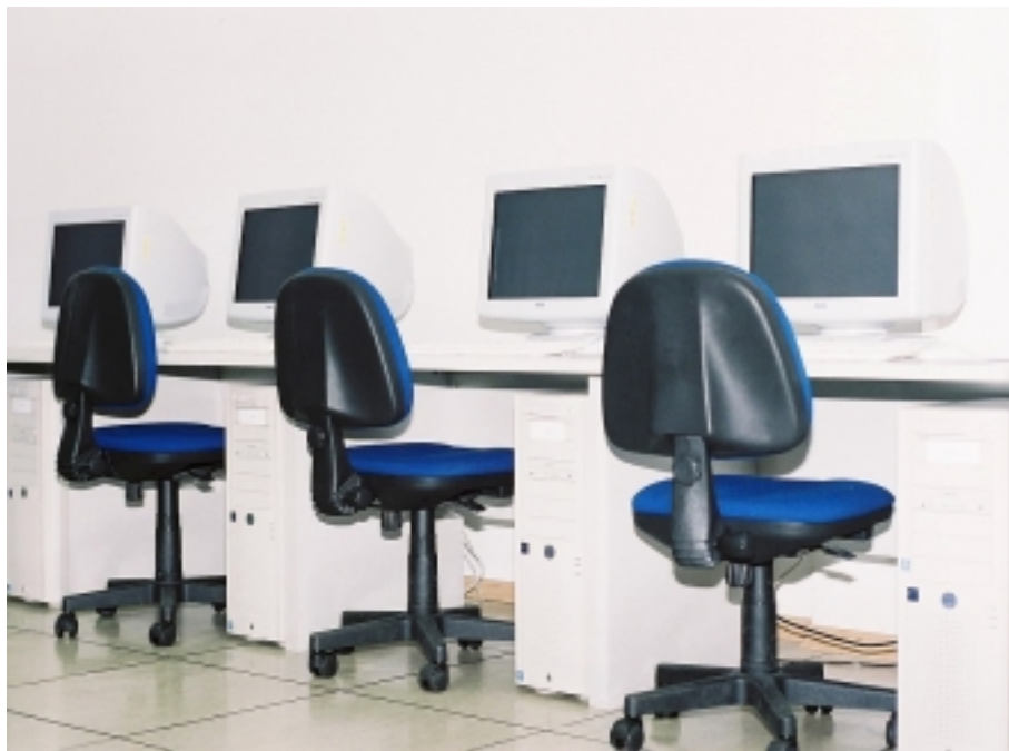
Fragment zespołu 9 węzłów obliczeniowych klastra o nazwie UKŁAD

Informacje producenta: http://www.hp.com.pl/product/974