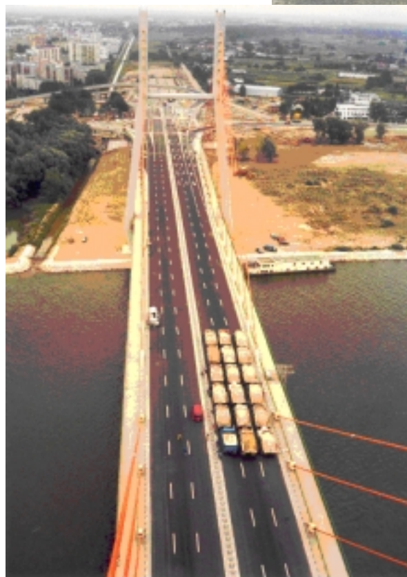
Badania Mostu Siekierkowskiego

Most wrocławski będzie mniejszy od pozostałych, lecz w klasie mostów betonowych też będzie rekordzistą.