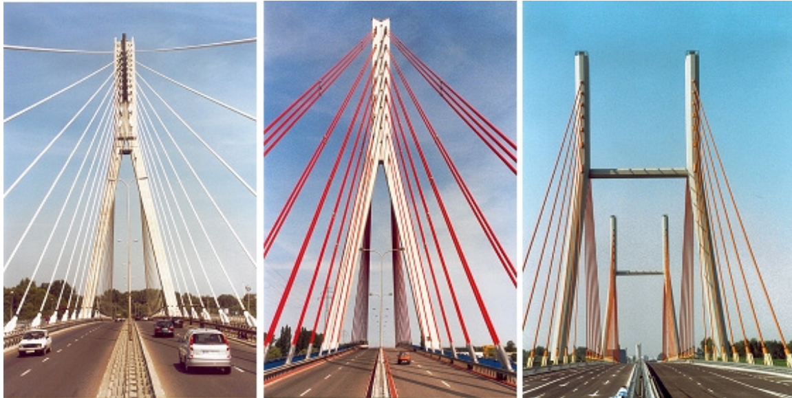
Największe mosty w Polsce: Most Świętokrzyski, Most III Tysiąclecia w Gdańsku, Most Siekierkowski

Badania aerodynamiczne wykonywane były w tunelu w CSTB Nantes we Francji,