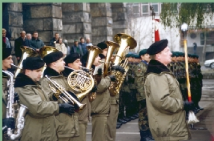
Orkiestra wojskowa wrocławskiego garnizonu uświetniła uroczystość wiązanką melodii patriotycznych.