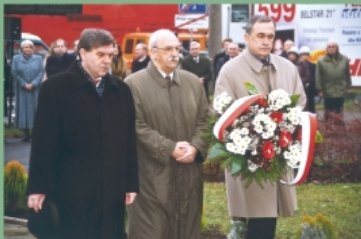
Reprezentacja Politechniki Wrocławskiej przed Pomnikiem Martyrologii Profesorów Lwowskich.