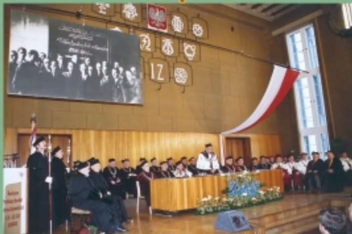
13 listopada na Politechnice Wrocławskiej uroczystość obchodząca Święto Nauki.