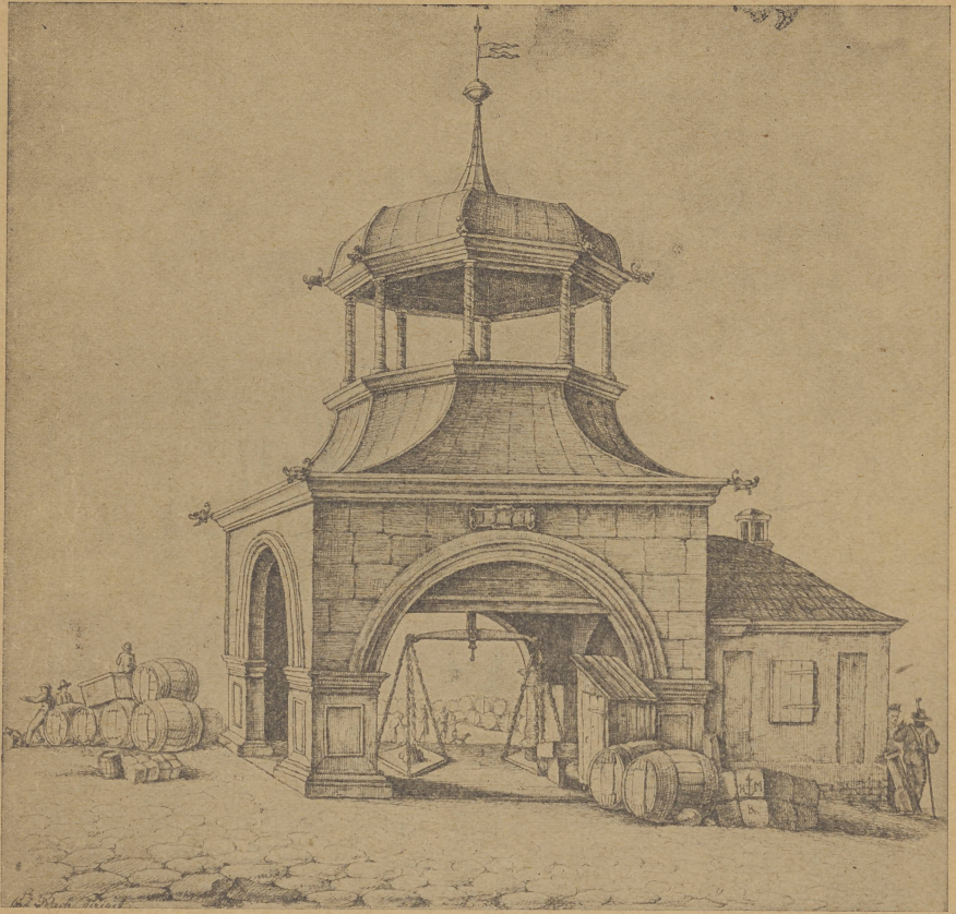
Die Große Waage von 1571 nach H. Mühel

Die Bilder sind dem Werk Rudolf Stein, Der Große Ring zu Breslau, entnommen.