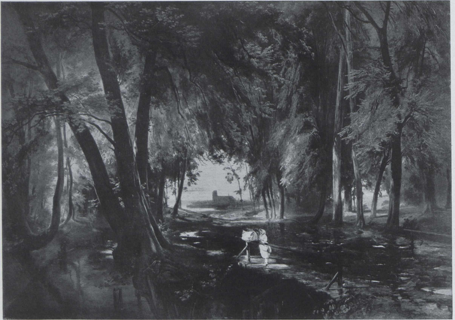
KARL BLECHEN: WALDWEG BEI SPANDAU