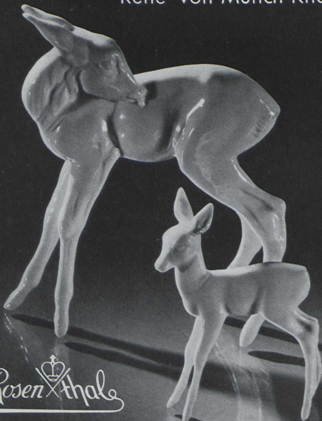
Rehe von Münch-Khe

Bezugspreis: Vierteljährlich 2,- RM. zuzüglich 4 Rpf. Bestellgeld. Einzelheft 1,- RM. Bestellungen können bei jeder Buchhandlung sowie bei jeder Postanstalt aufgegeben werden, oder auch direkt beim Verlag Breslau 5, am Sonnenplatz (Postcheckkonto Breslau 74 822, Fernruf 525 51 und 525 55). Anzeigenpreise (nur Seitenteile) nach Preisliste Nr. 1. Verantwortlicher Anzeigenleiter: i. V. Werner Steinberg, Breslau.