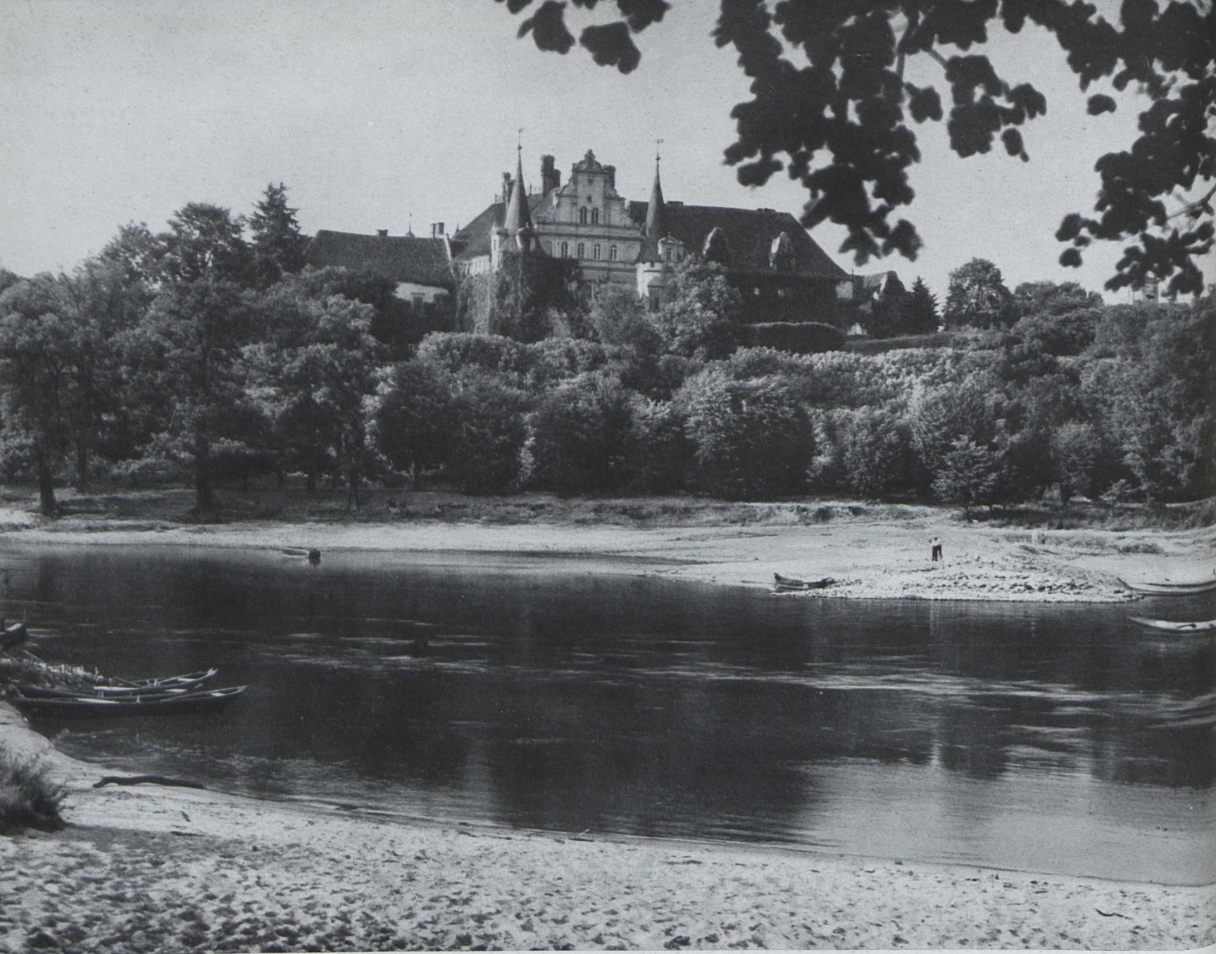
SCHLOSS CAROLATH AN DER ODER