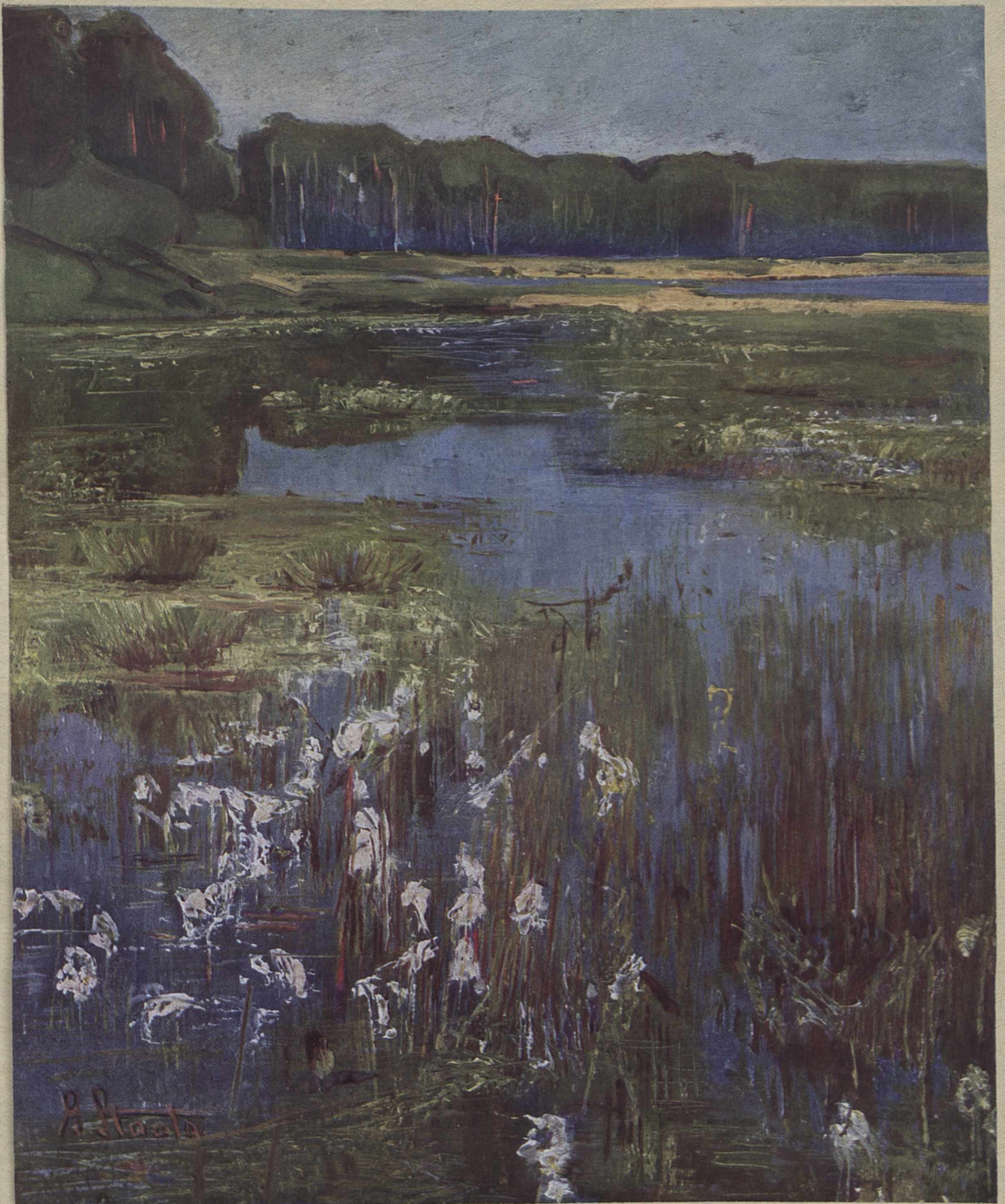
GERTRUD STAATS: „STILLES WASSER AN DER ODER“, ÖLSKIZZE IM BESITZ DES SCHLESISCHEN MUSEUMS DER BILDENDEN KUNSTE, Breslau