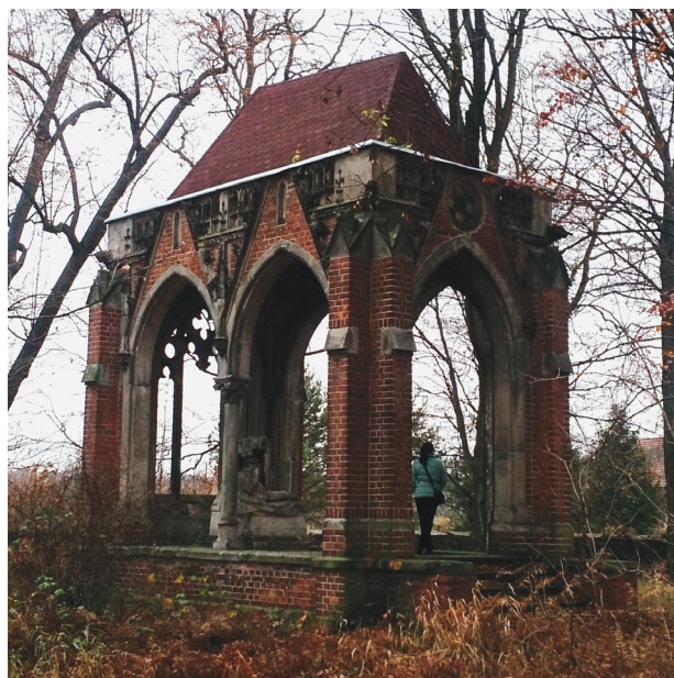
Il. 9. Widok zespołu mauzoleum w Jałowcu. Stan z 2015 r.

Ten cenny zespół nadal ulega powolnej dewastacji i pozostaje pozbawiony właściwej ochrony. W przyszłości, ze