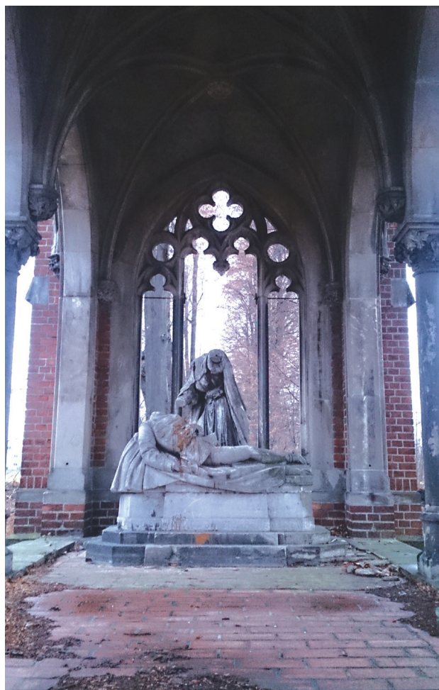
Il. 6. Zachowane fragmenty rzeźby Rudolfa Siemeringa, w tle widoczna aleja lipowa. Stan z 2015 r.

Fig. 6. Remains of the sculpture by Rudolf Siemering with a linden alley in the background. State of preservation in 2015