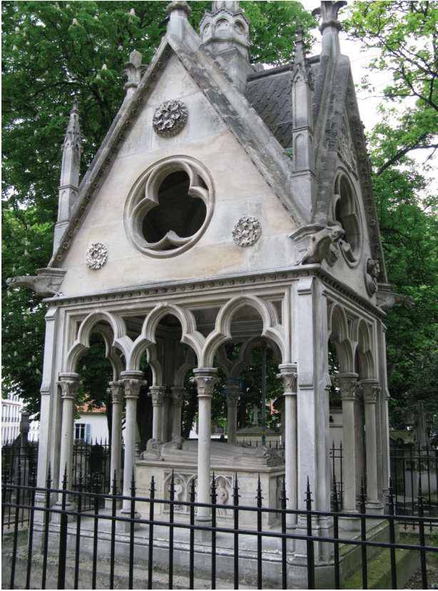
Il. 8. Najbardziej znane w XIX w. mauzoleum w układzie baldachimowym – grób Abelarda i Heloizy na Père Lachaise. Widoczny układ „ciężkiego” zadaszenia oraz delikatnych przypór. Stan z 2012 r.