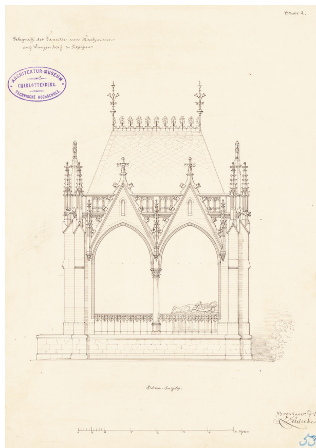
Il. 4. Elewacja boczna mauzoleum – druga wersja projektu Lüdeckego z 1881 r. (źródło: TUBAM Inv. Nr. 6045)

W obu wersjach Lüdeckego układ rzeźbiarski wewnątrz kaplicy miał inne znaczenie symboliczne niż rzeźba wprowadzona ostatecznie do mauzoleum. Zmarły miał spoczywać przykryty całunem grobowym na „gotyckiej” tumbie grobowej. Ale w przeciwieństwie do np. rzeźby przedstawiającej królową Luizę z mauzoleum projektu Schinkla w Charlottenburgu – nie był to raczej sen wieczny, lecz sen w oczekiwaniu na walkę. Lüdecke narysował postać zmarłego w całkowicie oryginalnym ujęciu – jako śpiącego na boku, z jedną ręką pod głową, a drugą ujmującą szablę. Zmarły, przedstawiony w mundurze huzarów, miał oczekiwać na wezwanie do walki. Również stojąca u wezglowia, uskrzydłona i wyraźnie kobieca postać to