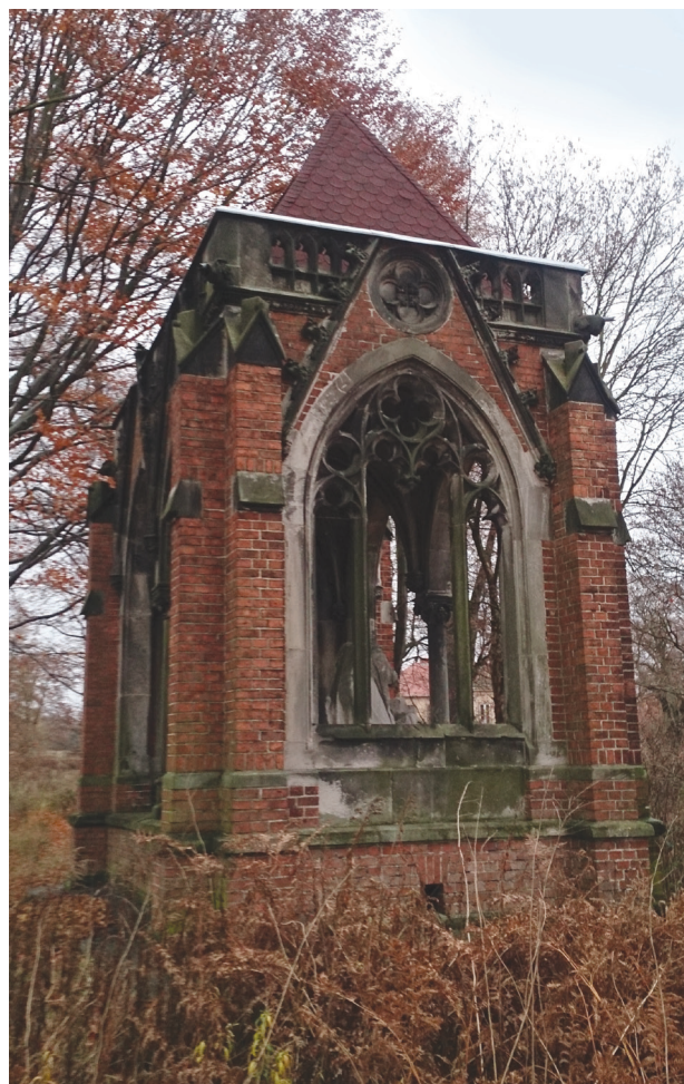
Il. 7. Elewacja tylna z oknem maswerkowym, widok od strony alei lipowej. Stan z 2015 r.

Fig. 6. Remains of the sculpture by Rudolf Siemering with a linden alley in the background. State of preservation in 2015