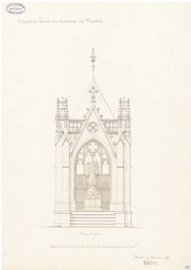
II. 2. Elewacja frontowa mauzoleum – pierwsza wersja projektu Lüdeckego z 1870 r. (źródło: TUBAM Inv. Nr. 6040)

Fig. 2. Facade of the mausoleum – 1 st version of the design by Lüdecke from 1870 (source: TUBAM Inv. Nr. 6040)