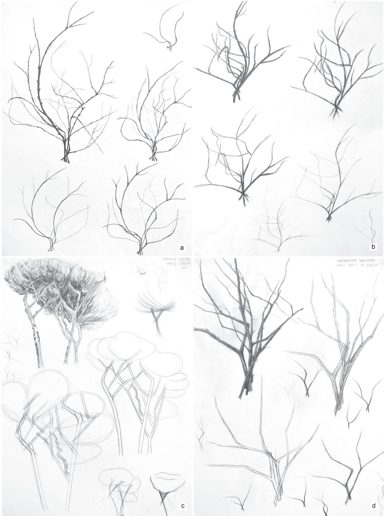
II. 1. Synteza drzewa; autorzy: a) P. Michalska, b) E. Zemelka, c) N. Ojczyk, d) A. Skrzypek Fig. 1. Synthesis of a tree; drawing by: a) P. Michalska, b) E. Zemelka, c) N. Ojczyk, d) A. Skrzypek