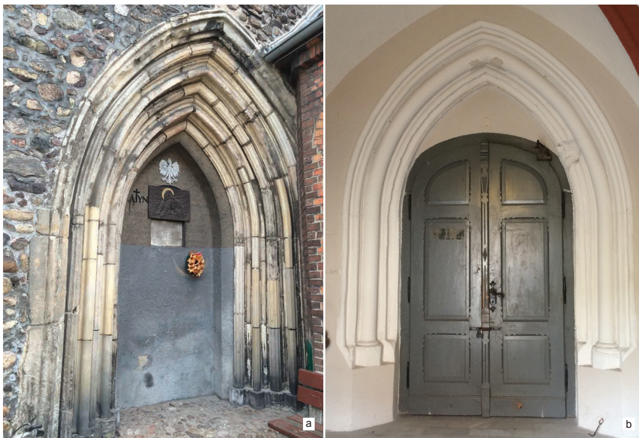
Il. 9. Szprotawa, kościół Wniebowzięcia NMP: a) portal zachodni, b) portal północny

Thanks to the registered relics, it is possible to try to reconstruct the church's mass which was probably constructed in the second half of the 13 th century and finished at the beginnings of the next century. The eastern part consisted of a presbytery with a plan like a rectangle. The layout of its interior remains unknown, but a considerable width of the footing indicates that it could have been covered with a vault. The body, which was probably erected soon after the gallery was built, was shaped as a part consisting of three bays. This sort of solution is indicated by the location of the lancet window on the northern side and