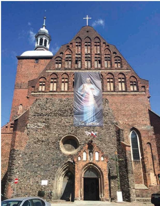
Il. 1. Szprotawa, kościół Wniebowzięcia NMP, elewacja zachodnia z reliktem fasady z 2. połowy XIII w. (fot. A. Legendziewicz)