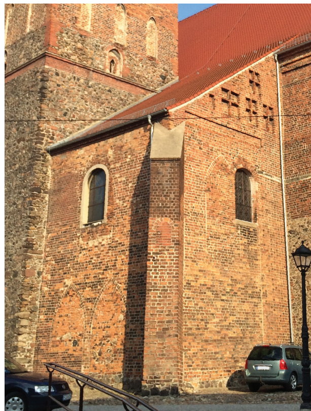
Il. 6. Szprotawa, kościół Wniebowzięcia NMP, kaplica Świętego Krzyża

Najstarszą wzmiankę o kościele w Szprotawie zawiera dokument, wystawiony 1 grudnia 1260 r., w którym brat Wit (Vitus) dawny biskup Litwy udziela odpustu pielgrzymom odwiedzającym Ołtarz Maryjny [1, Rep. 120, nr 1], [2, nr 1067]. Dwukrotnie świątynia występuje w aktach z kancelarii biskupa wrocławskiego Tomasza II. W pierwszym z 21 października 1283 zatwierdza on dochody kościoła i podporządkowuje parafii filię w Dzikowicach, a w drugim z 10 czerwca 1290 r. – potwierdza wspomnianą wcześniej decyzję [3, s. 1, 5]. 1 grudnia 1314 r. biskup Henryk z Wierzbna przeniósł, dzięki staraniom Mechtyldy – wdowy po księciu Henryku III Głogowskim – i jej syna księcia Henryka IV Wiernego, zakon magdalenek z Bytomia Odrzańskiego do Szprotawy [3, s. 6], [4, nr 3437], [5, s. 4]. Przekazanie praw patronatu