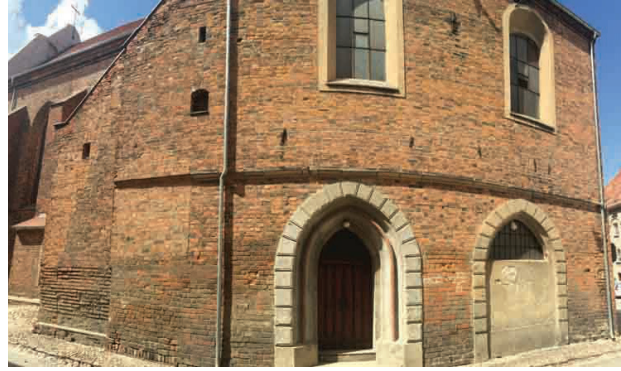
Il. 4. Szprotawa, kościół Wniebowzięcia NMP, widok chóru magdalenek i reliktu ganka

Bardzo skromny detal ma elewacja północna. Skrajnie zachodnie przeszło korpusu pozbawione jest wystroju poza płyciną fryzową w partii podokapowej i piaskowcowego gzymsu odkapnikowego (obecnie skutego). Gładkie płaszczyzny ścian kaplicy Świętego Krzyża dekorują jedynie dwa półkoliste okna, a w partii półszczytu dwa pasy prostokątnych wnęk dzielonych krzyżami łańcuchowymi. Narożnik ścian wspiera przypora z zablokowaną wnęką. W ścianie północnej widoczne są zamurowane: