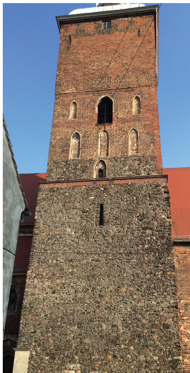
Il. 7. Szprotawa, kościół Wniebowzięcia NMP, wieża w widoku od północy

The area of the oldest church is marked by walls which were constructed of stone with blocks of bog ore used in the corners (Fig. 8a, b). In the western front wall, which is preserved to the height of the base of the current gable, we can see the facade enclosed with two diagonally set