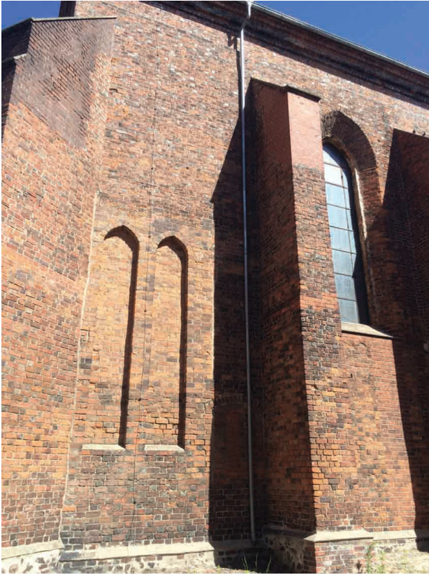
Il. 3. Szprotawa, kościół Wniebowzięcia NMP, zachodni skraj elewacji południowej, elewacja kaplic z połowy XIV w.

Fig. 3. Szprotawa, the Assumption of the Blessed Virgin Mary Church, the western edge of the southern facade, facades of chapels from the mid-14 th century