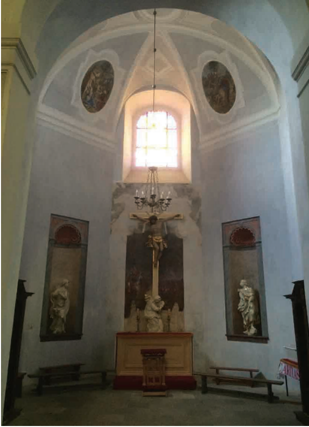
Il. 10. Szprotawa, kościół Wniebowzięcia NMP, widok wnętrza kaplicy Świętego Krzyża