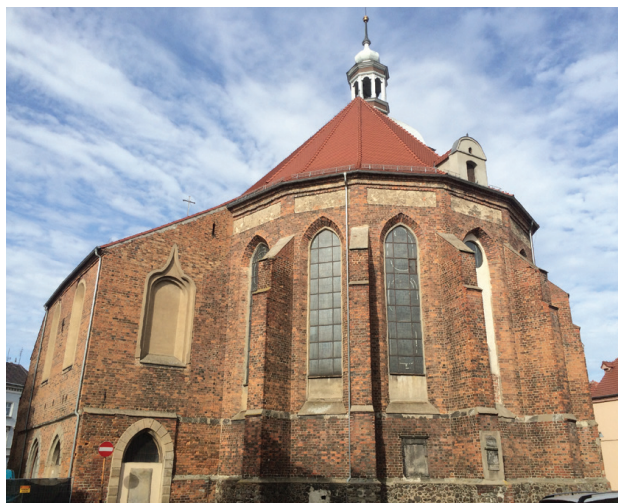
Il. 5. Szprotawa, kościół Wniebowzięcia NMP, prezbiterium w widoku od wschodu