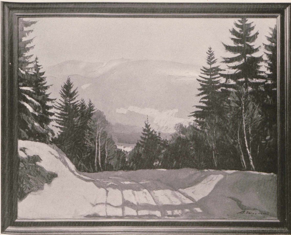
Artur Wasner: Motiv am »fernpaß«