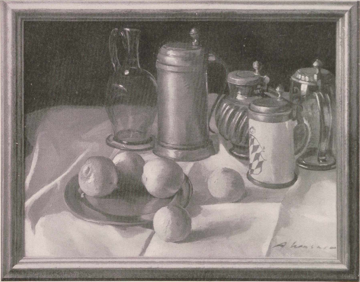
Artur Wasner: Stilleben