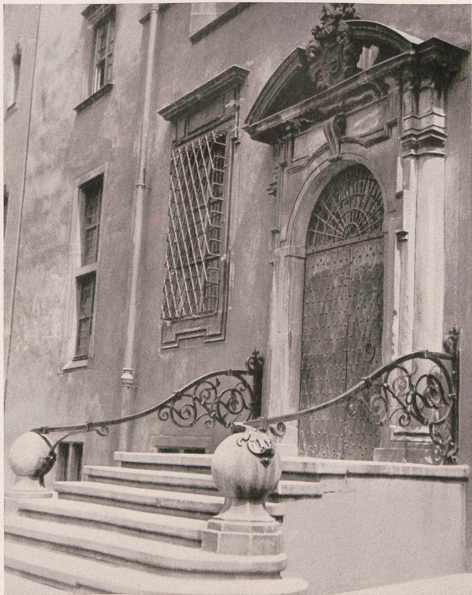
Westportal des Rathauses - ein wenig beachteter Eingang