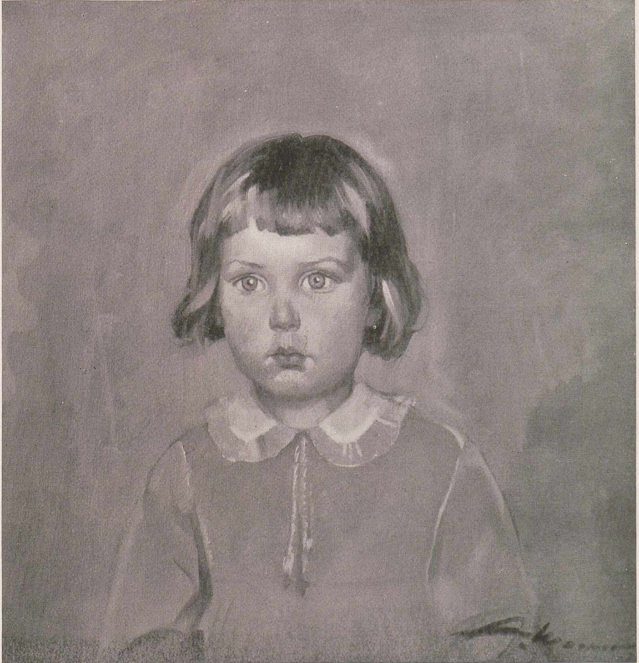
Artur Wasner: »Barbara«