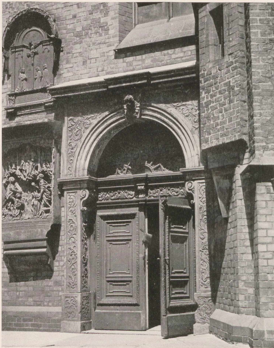
Eine der vielen Türen an der Elisabethkirche