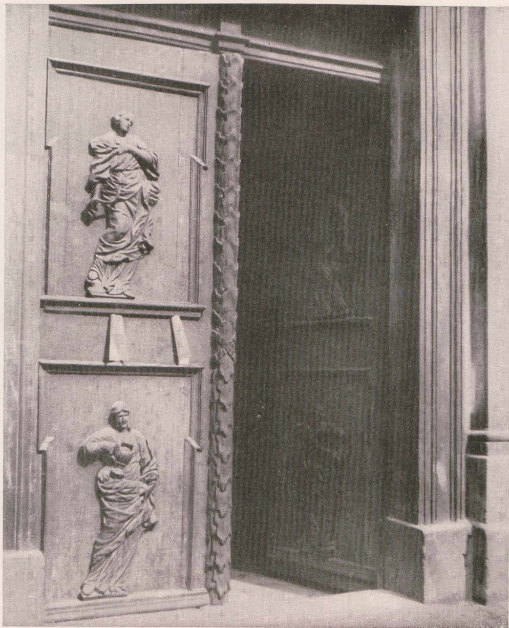
figürlicher Schmuck an der Tür des Südportals der Vinzenzkirche