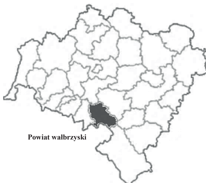
Rys. 1. Powiat wałbrzyski na mapie województwa dolnośląskiego

Powiat wałbrzyski znajduje się w południowej części województwa dolnośląskiego (zob. rys. 1) i zajmuje powierzchnię 430 km 2 , na której w 2016 r. mieszkało 56,8 tys. osób.