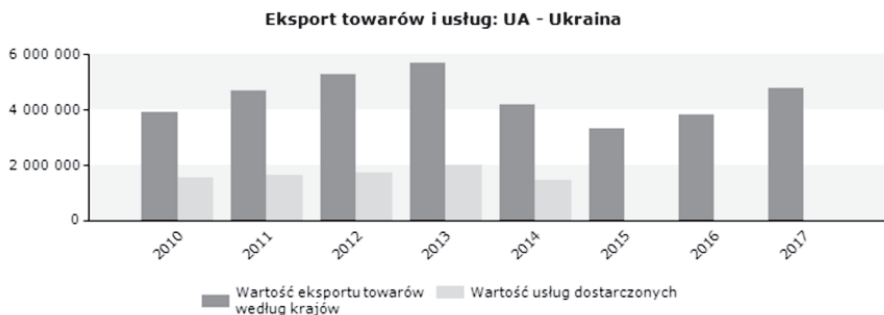
Rys. 1. Polski eksport na rynek ukraiński na przestrzeni lat 2010-2017

Rok: 2010, 2011, 2012, 2013, 2014, 2015, 2016, 2017 Kraj: UA - Ukraina Waluta: tys. USD