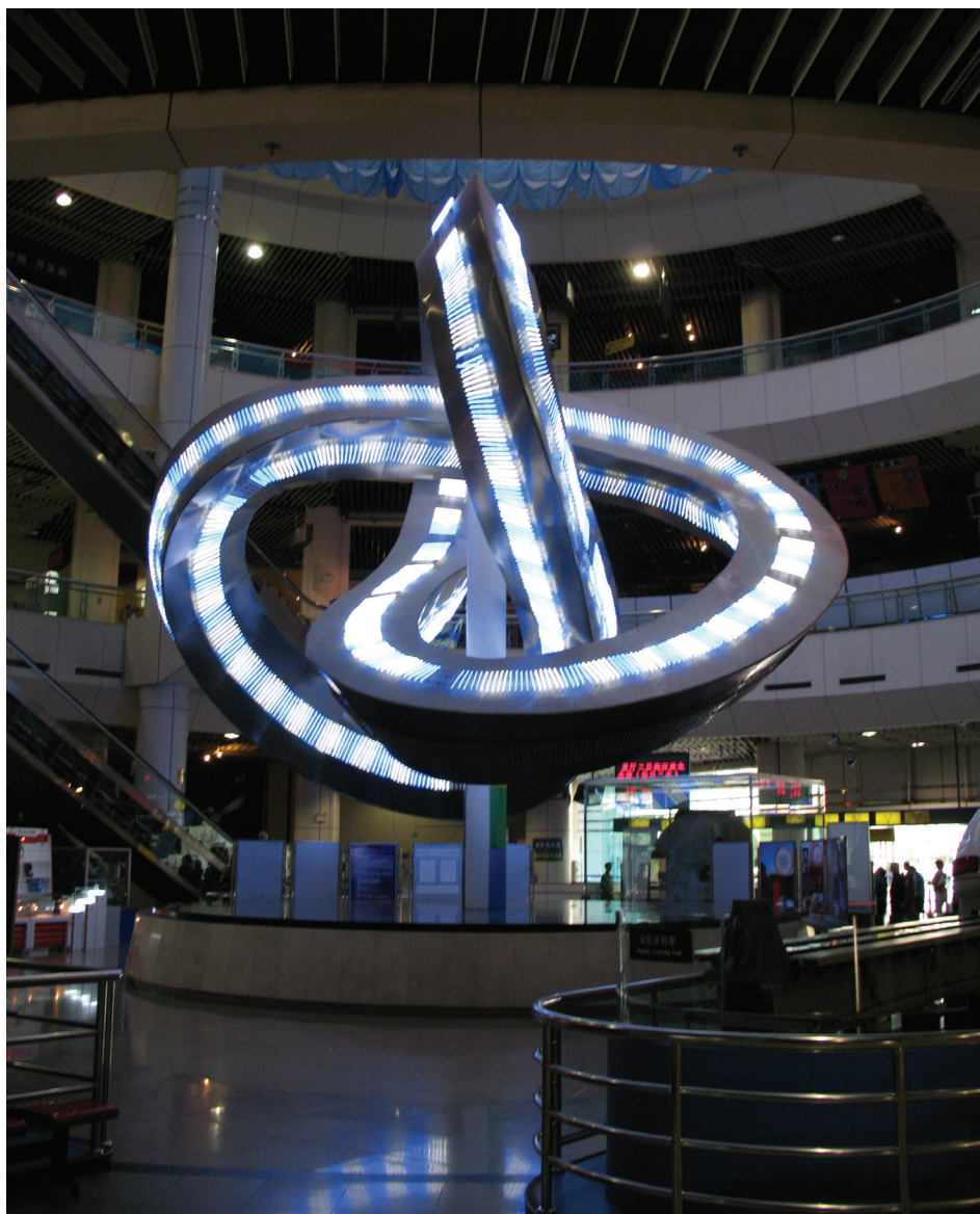
Il. 2. Iluminacja struktury przestrzennej sterowana przez program komputerowy. Ekspozycja w Muzeum Nauki i Techniki w Pekinie