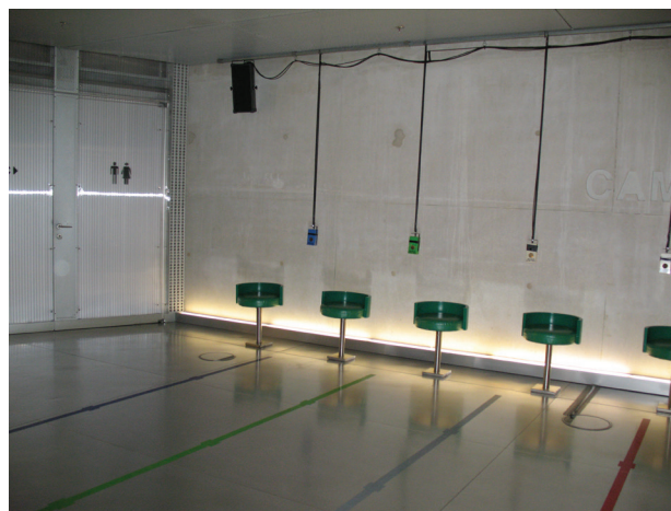
Il. 4. Generowanie dźwięków w przestrzeni przez ruchy człowieka. Ekspozycja w Casa da Música w Porto

Fig. 3. Generating of the light-pixels by man's motion. Exhibition, The National Art Museum of China, Beijing