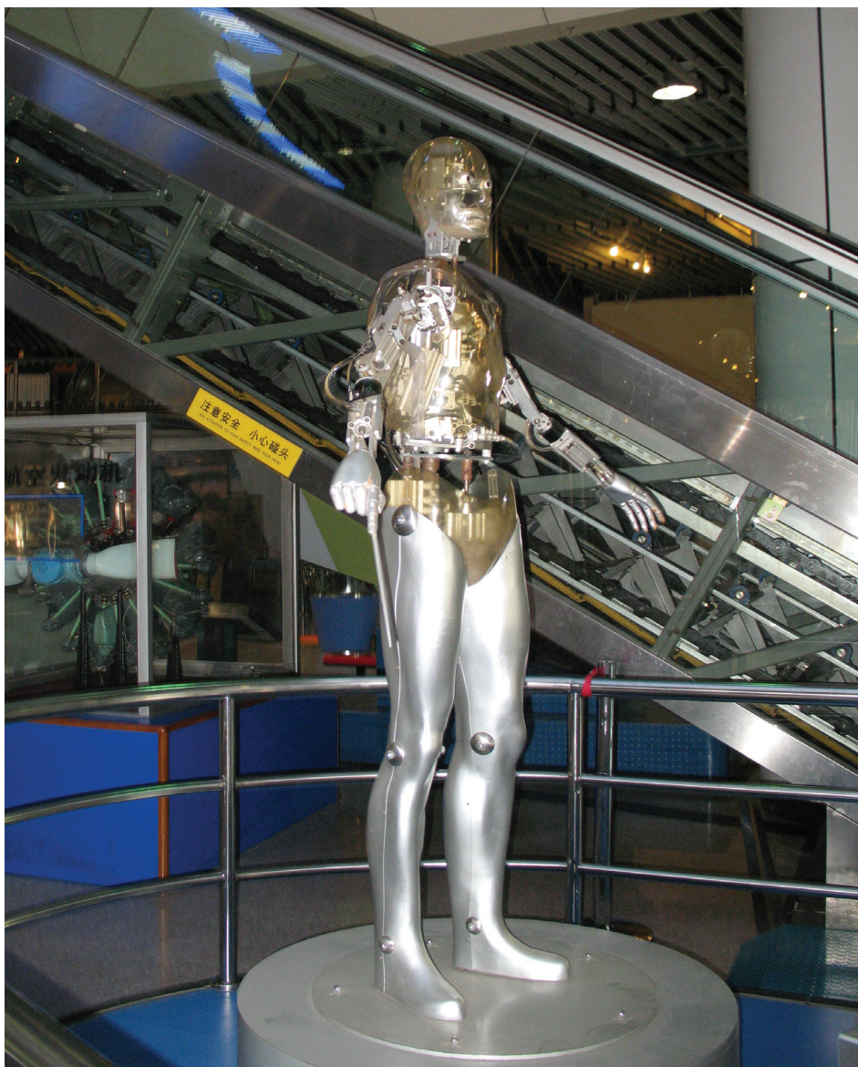
Il. 1. Uczłowieczony robot – zrobotyzowany człowiek. Ekspozycja w Muzeum Nauki i Techniki w Pekinie