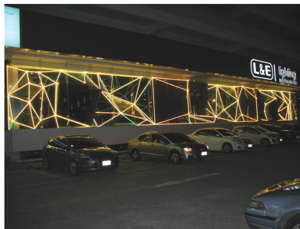
II. 6. Struktura przestrzenna jako przepływ energii świetlnej. Fasada medialna sterowana programem komputerowym, Bangkok