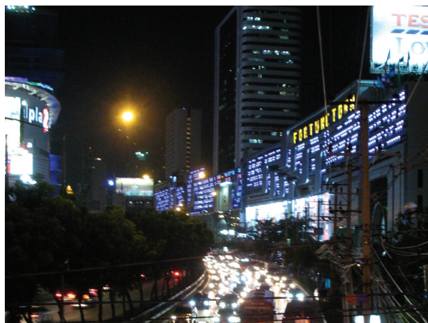
II. 5. Struktura przestrzenna jako przepływ energii świetlnej. Fasada medialna sterowana programem komputerowym, Bangkok