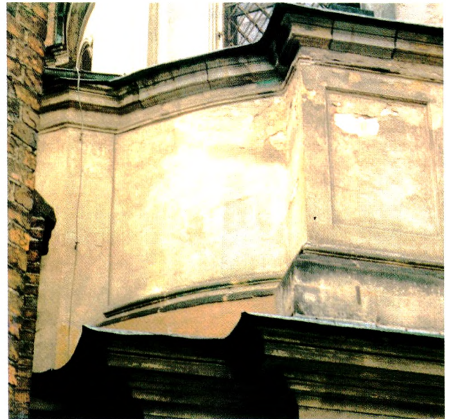
Ryc. 1. Fragmenty tynków barwnych odkryte na elewacjach barokowych kaplic św. Elżbiety i Bożego Ciała – Elektorskiej (po prawej u dołu)

kujące podobieństwo zastosowanej metody i kolorystyki na trzech budowlach, powstałych w różnym czasie w ciągu około półwiecza (ok. 1700, 1724 i ok. 1750) jest trudne