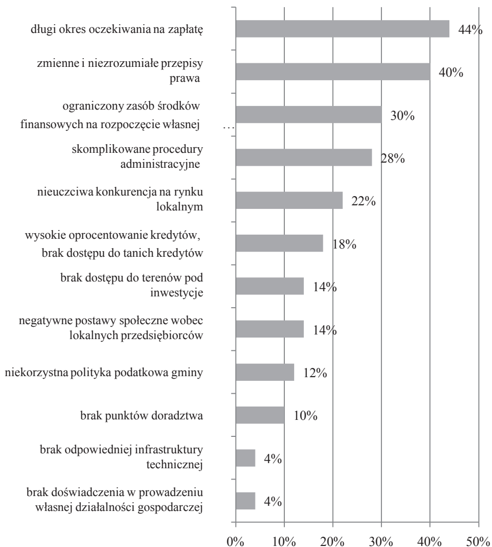
Rys. 3. Bariery rozwoju przedsiębiorczości na obszarach wiejskich powiatu radzyńskiego w opinii właścicieli przedsiębiorstw (odpowiedzi nie sumują się do 100%)

Respondenci dostrzegli więc znacznie więcej barier niż czynników wpływających pozytywnie na funkcjonowanie i wzrost ich działalności gospodarczych.