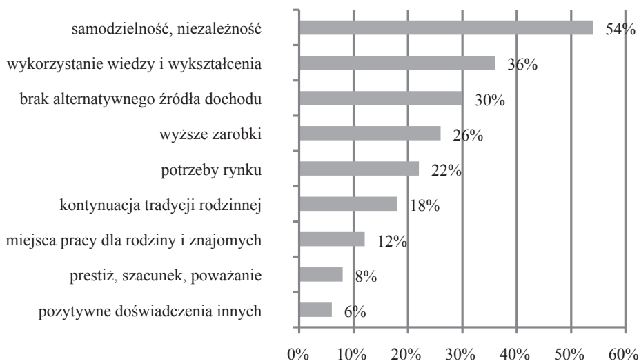
Rys. 1. Motywy prowadzenia własnej działalności gospodarczej (odpowiedzi nie sumują się do 100%)

Respondentów zapytano o główne czynniki motywujące ich do prowadzenia działalności gospodarczej. Najczęstszym powodem prowadzenia własnej działalności gospodarczej przez badanych przedsiębiorców, który zadeklarowała ponad połowa respondentów, była chęć osiągnięcia niezależności i samodzielności (54%). Kolejną przyczyną to możliwość wykorzystania zdobytej wiedzy i wykształcenia w praktyce (36%). Równie często przedsiębiorcy kierowali się w swoim wyborze brakiem alternatywnego źródła dochodu oferowanego przez publiczne bądź prywatne zakłady pracy w miejscu zamieszkania (30%), a także chęcią osiągnięcia wyższych zarobków (26%). 11 przedsiębiorców motywowała chęć zaspokojenia potrzeb rynku (22%), a 18% badanych perspektywa kontynuacji tradycji rodzinnej. Respondenci w mniejszym stopniu wskazali na pozostałe motywy, takie jak: stworzenie miejsc pracy dla członków rodziny bądź znajomych (12%), zyskanie szacunku i prestiżu (8%), a także sugerowanie się pozytywnymi doświadczeniami innych przedsiębiorców (6%). Szczegóły przedstawiono na rys. 1.