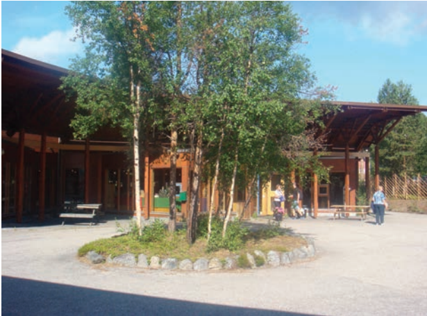
Il. 5. Centrum Kultury Saamów w Karasjok – widok od strony wewnętrznego dziedzińca