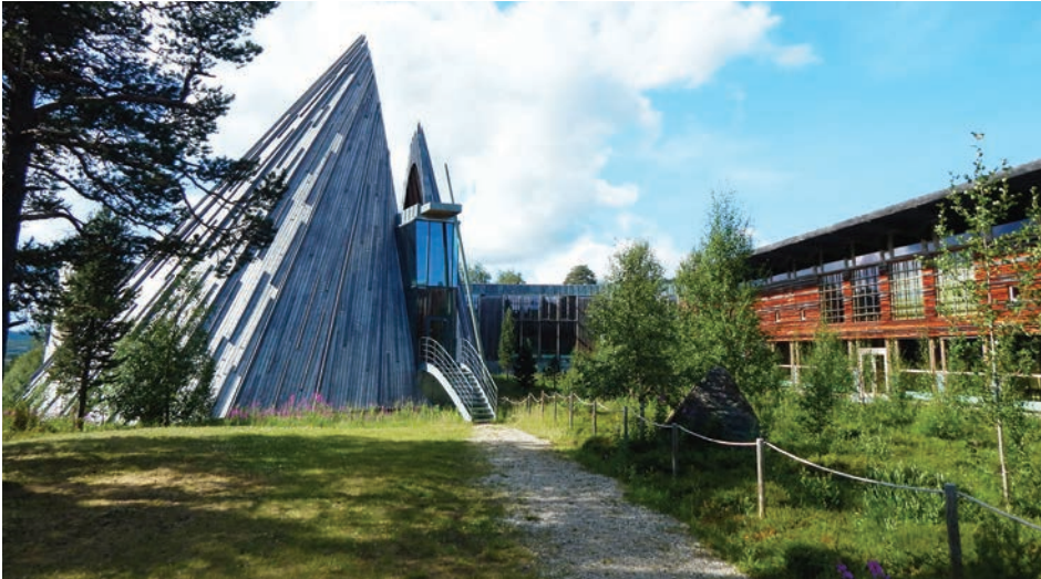
Il. 7. Parlament Saamów w Karasjok – widok od strony wnętrza założenia

Fig. 7. The Saami Parliament in Karasjok – view from the inside of the layout