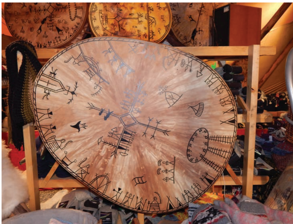
Il. 1. Tradycyjny saamski bęben – troll – wykonany ze skóry renifera i zdobiony runami