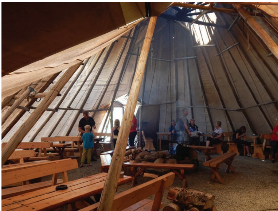
Il. 3. Wnętrze lavvo z centralnie usytuowanym paleniskiem