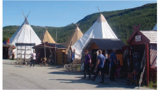
Il. 4. Namioty lavvo zaadaptowane na sklepiki z tradycyjnym rękodziełem w rejonie Troms

Podobne inspiracje odnaleźć można w dwóch najpiękniejszych z saamskich budowli w Karasjok: Centrum Kultury Saamów (norw. Samelandssenteret , arch. Arne Bjerk i Eilif Bjørge sivilarkitekter MNAL NPA, realizacja 1990) i Budynku Parlamentu Saamów (norw. Sametinget , sam. Sámediggi , arch. Stein Halvorsen AS i Christian