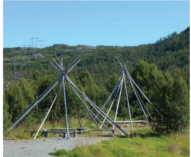
Il. 2. Tradycyjne konstrukcje lavvo w krajobrazie Finnmarku