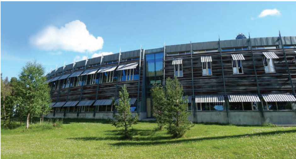
Il. 8. Parlament Saamów w Karasjok – widok od strony zewnętrznej założenia

Fig. 7. The Saami Parliament in Karasjok – view from the inside of the layout