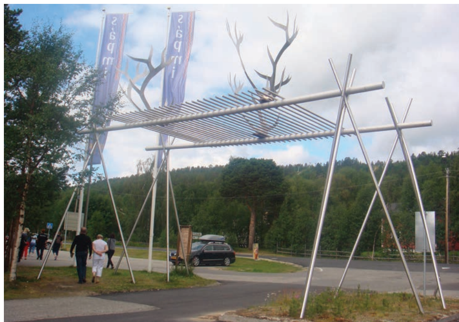
Il. 6. Centrum Kultury Saamów w Karasjok – brama wejściowa z animalistycznymi motywami rzeźbiarskimi