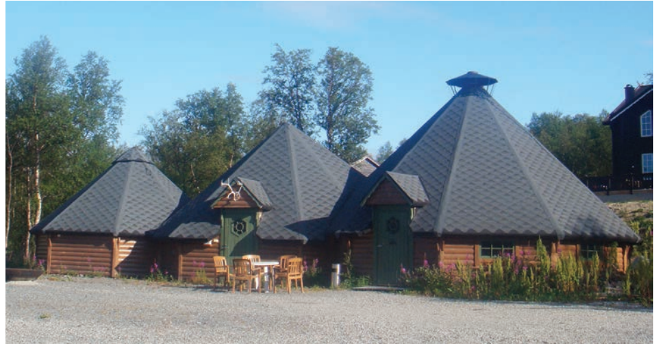
Fig. 9. Modern Saami restaurant in Skaidi in northern Finnmark

Bing Lorentzem, realizacja 1987), Muzeum Wschodnich Saamów w Neiden (norw. Østsamisk museum , arch. Mette Melandsø, Peter Paus, realizacja 2009) oraz szkoły: Lappoluobbal w Kautokeino (norw. Lappoluobbal barneskole , arch. Kjell Borgen, Bing Lorentzem, realizacja 1976) i Saamski College w Karasjok (norw. Samisk vidergående , arch. Atelier 2, Alta, realizacja 1979, rozbudowa 1990). Każde z tych założeń na swój indywidualny sposób oddaje horyzontalnie uwarunkowany krajobraz Finnmarku.