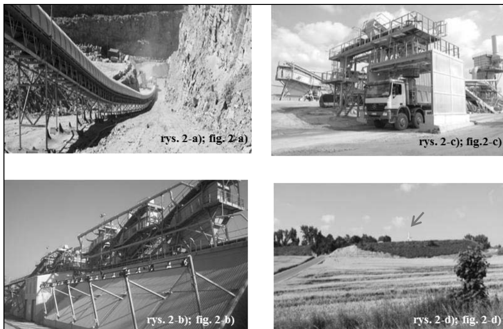
Rys. 2. Ilustracje obiektów kopalni Wieśnica w aspektach bezpieczeństwa HSE: a) zmodyfikowany układ wydobywczy z zastosowaniem transportu przenośnikowego, b) zakład przeróbczy – kompaktowy, zhermetyzowany z instalacją odpylającą, c) stacja załadunkowa kruszyw – z odpylaniem i zraszaniem oraz rękawem teleskopowym, d) widok na kopalnię z drogą przemysłową i kominem stacji odpylania Fig. 2. Illustrating the processes in Wieśnica mine in safety aspects HSE: a) a modified extraction system using staggered transport of the conveyor; b) processing plant – a compact, encapsulated and fired c) the aggregate loading station – with high dust and spraying and telescopic sleeve; d) the views of the mine with road and industrial dust collection station chimney (author T. Wojtaszek)

Łączna wartość inwestycji technicznych rozbudowy kopalni Wieśnica, wyniosła około 36,5 mln zł, w tym wartość zadań, które istotnie poprawiły poziom bezpieczeństwa w kopalni to około 15,5 mln zł. Udział nakładów służących ochronie HSE stanowił 42% wartości inwestycji, a ich strukturę przedstawia rysunek 3.