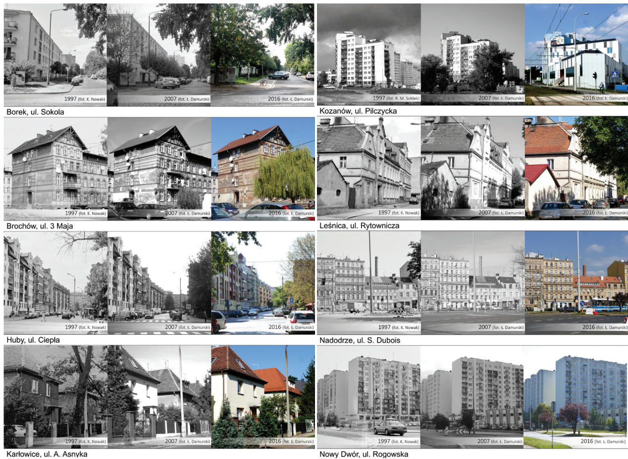
II. 2. Dokumentacja fotograficzna wybranych osiedli Wrocławia w latach 1997, 2007 i 2016.

Osiedla: Borek, Brochów, Huby, Karłowice, Kozanów, Leśnica, Nadodrze, Nowy Dwór