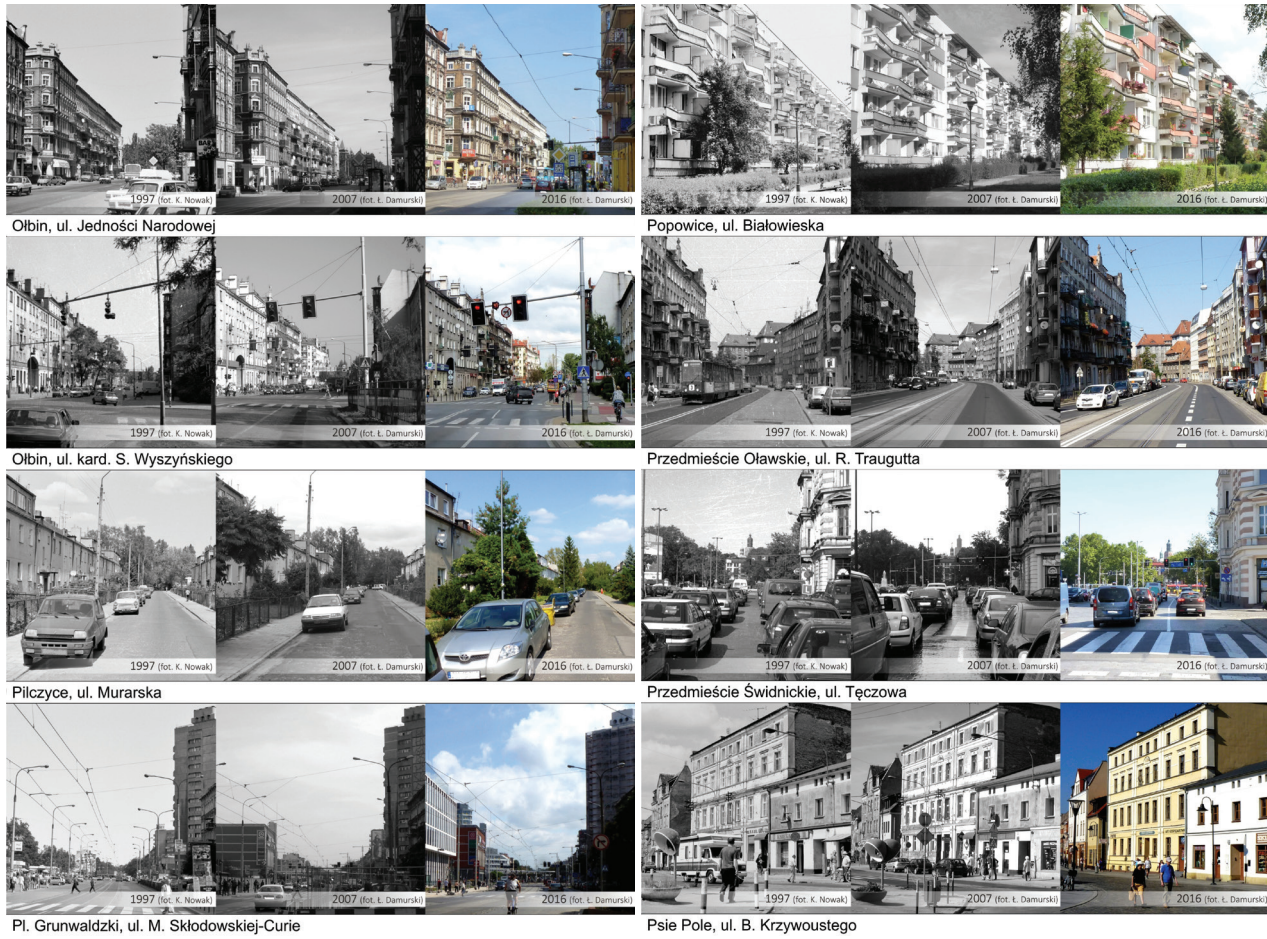
II. 3. Dokumentacja fotograficzna wybranych osiedli Wrocławia w latach 1997, 2007 i 2016.

Osiedla: Olbin, Pilczyce, Plac Grunwaldzki, Popowice, Przedmieście Oławskie, Przedmieście Świdnickie, Psie Pole