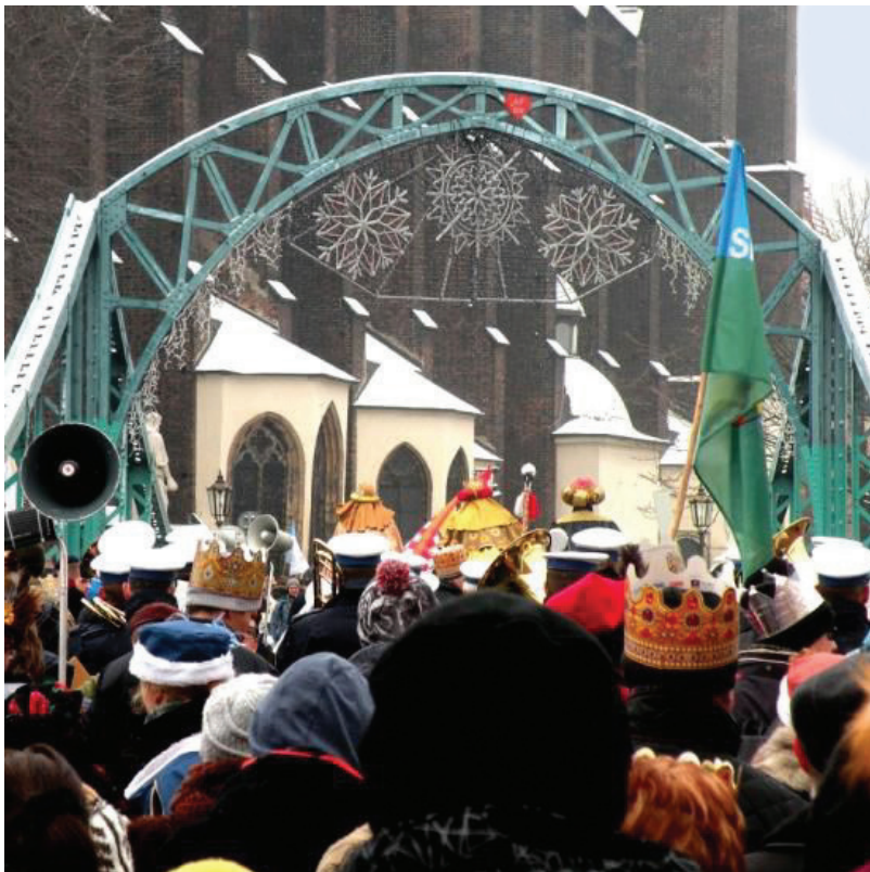
Orszak Trzech Króli 2016 we Wrocławiu. Zainicjowana w 2011 r. forma świętowania uroczystości kościelnej szybko i na stałe wpisała się w kalendarium imprez masowych Wrocławia

Procession of the Three Kings in 2016 in Wrocław. A new form of celebrating a Church ceremony which has been initiated in 2011, promptly and permanently introduces into the calendar off mass entertainment in Wrocław