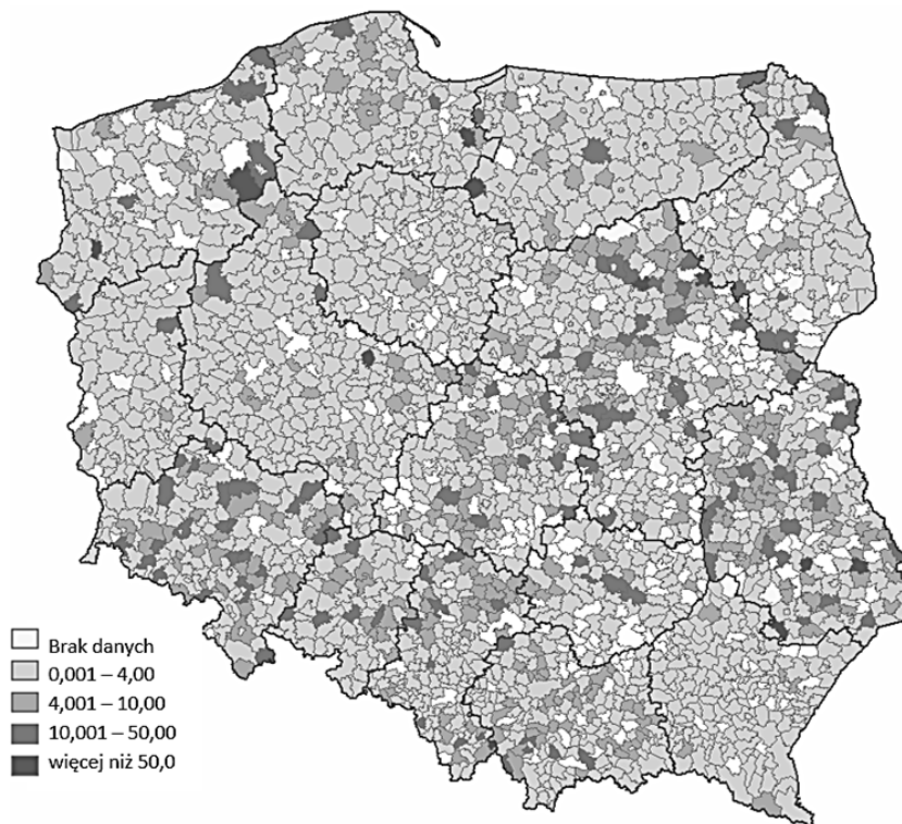
Rys. 3. Wskaźniki pojemności demograficznej dla gmin na podstawie mpzp w 2014 r.