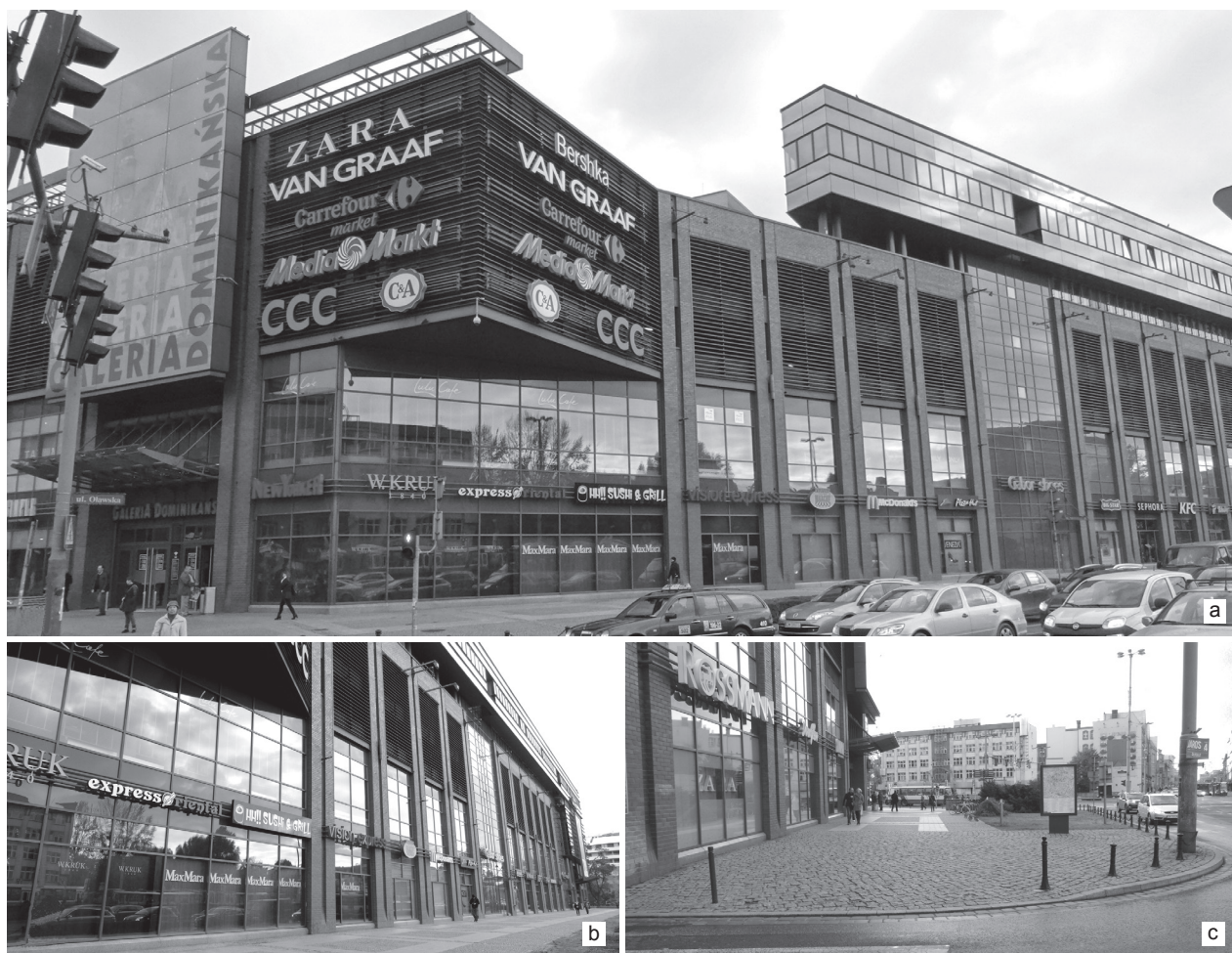
Il. 2. Przykłady najsilniejszych komunikatów we współczesnej przestrzeni publicznej. Wrocław, plac Dominikański: a) najbardziej eksponowany narożnik od strony placu, b) ściana wzdłuż ciągu pieszego bez drzwi i okien, za to w całości wypełniona wielkopowierzchniowymi reklamami, c) strefa wejściowa bez jakiegokolwiek wyposażenia dla mieszkańców, natomiast oznakowana logotypami globalnych marek