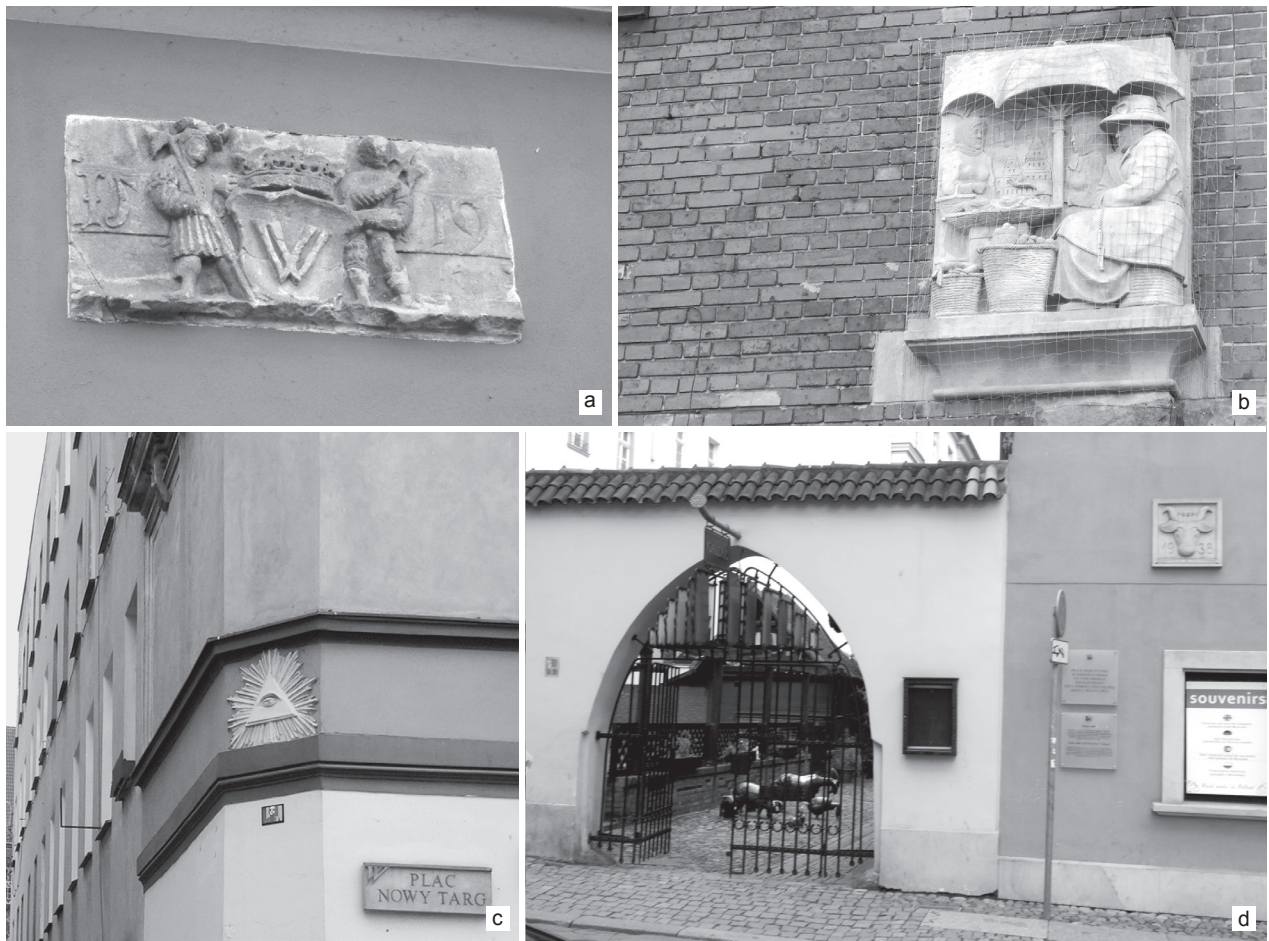
Il. 1. Przykłady znaków w historycznej przestrzeni publicznej, odwołujących się do grup mieszkańców i do ich aktywności. Wrocław, ulice: a), b) Piaskowa, c) plac Nowy Targ, d) Odrzańska, wejście na ulicę Stare Jatki