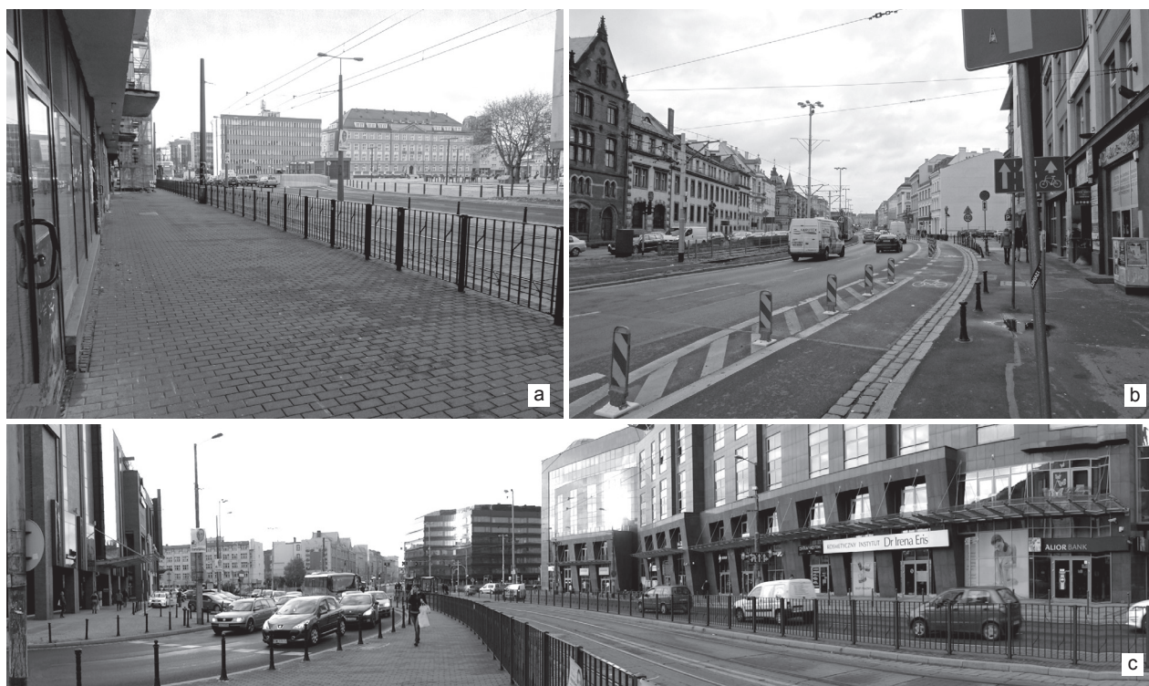
Il. 5. Różne sposoby użytkowania i inni zarządcy terenów wchodzących w zakres obszaru określonego w Studium jako przestrzeń publiczna [22]. Granice oddzielające odmienne przeznaczenia i funkcje są widoczne w formie barier, płotów i różnych materiałów nawierzchni. Wrocław: a) plac Nowy Targ, b) ul. Kazimierza Wielkiego, c) plac Dominikański