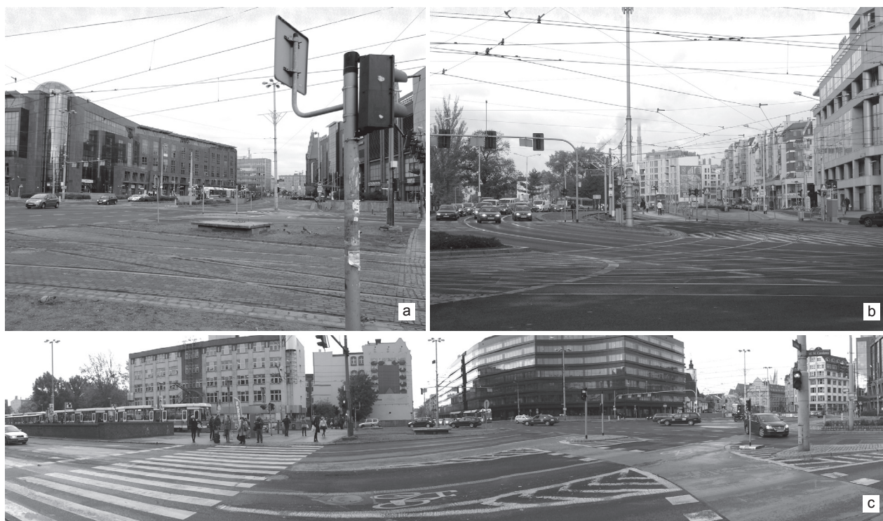
Il. 4. Przykład przestrzeni publicznej wyznaczonej na węźle komunikacyjnym, która w całości zdominowana jest przez infrastrukturę drogową. Wrocław: a), c) plac Dominikański, b) plac Bema