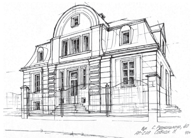
Il. 8. Szkic urbanistyczny willi w stylu art déco (ul. Rudnytskoho 40) (tusze, rys. student 3. semestru N. Savchak, 2012)

Fig. 7. Urban sketch of Secession villa (8 Metrolohichna str.) (watercolor, pen, pencil, author – 3 rd year student K. Prohasko, 2013)