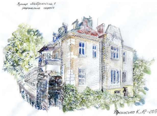
Il. 7. Szkic urbanistyczny willi secesyjnej (ul. Metrolohichna 8) (akwarela, pióro, ołówki, rys. student 3. semestru K. Prohasko, 2013)

Fig. 7. Urban sketch of Secession villa (8 Metrolohichna str.) (watercolor, pen, pencil, author – 3 rd year student K. Prohasko, 2013)