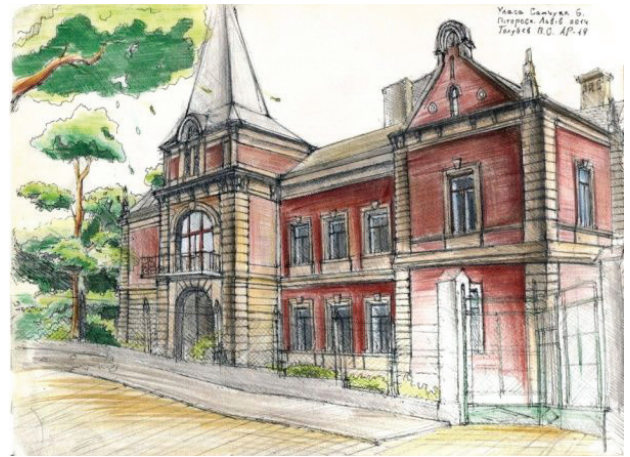
Il. 4. Szkic urbanistyczny malowniczej willi (ul. Samchuka 6) (tusz, kolorowe kredki, rys. student 3. semestru V. Holubyev, 2014)

Willa stała się wiodącym stylem budownictwa w stylu „pittoresco” (lata 90. XIX w.), ponieważ dawała możliwość ukazania wszystkich trendów związanych z życiem