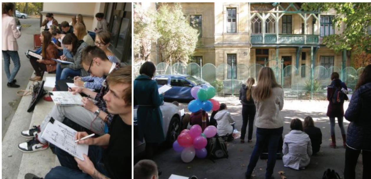
Il. 1. Studenci architektury szkicują wille Lwowa, 2012–2014