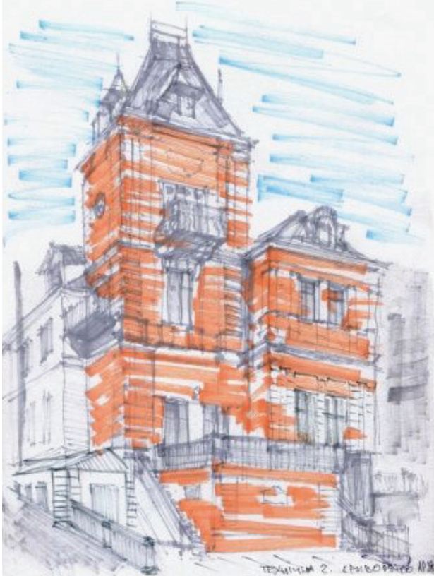
Il. 3. Szkic urbanistyczny „willi rodziny Bromilskij”, historicism z elementami stylu ojczystego (flamaster, rys. student 3. semestru – V. Kryvoruchko, 2014)