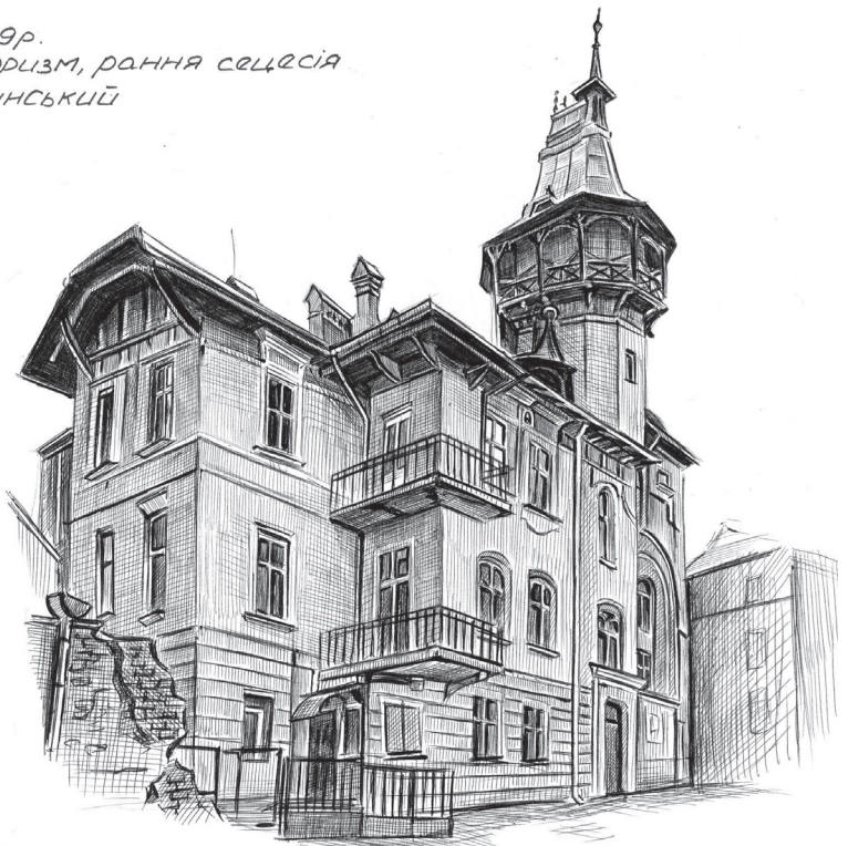
Il. 5. Szkic urbanistyczny willi I. Dolynskiego (pióro, rys. studentka 3. semestru I. Makovska, 2013)

Вілла 1899р. Пізній історизм, рання сецесія Арх. Я. Долінський