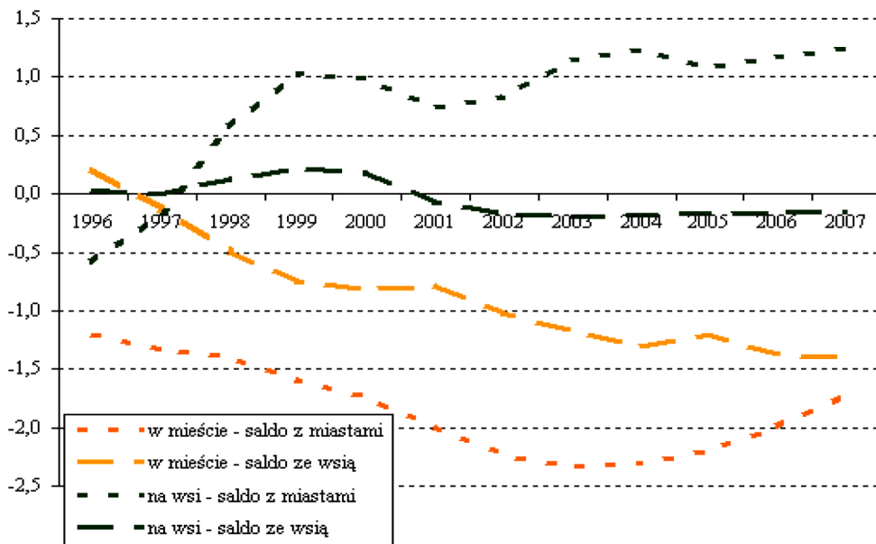
Rys. 2. Saldo migracji wewnętrznych na pobyt stały na 1000 mieszkańców