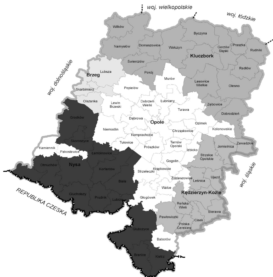
Rys. 1. Granice biegunów wzrostu województwa opolskiego

konieczność uzyskania efektu synergii w procesach rozwojowych dwóch największych ośrodków miejskich subregionu, czyli Kędzierzyna-Koźla i Strzelec Opolskich. Zgodnie z analizą jednostki te powinny ze sobą współpracować, a nie konkutować, gdyż rywalizacja na tak małym obszarze o te same zasoby obniża zdolność subregionu do konkutowania z silniejszymi ośrodkami.