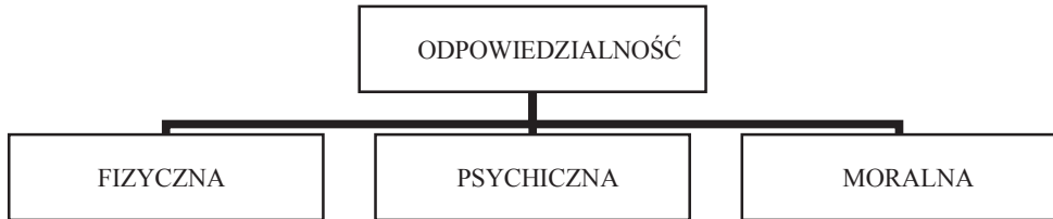
Rys. 2. Rodzaje odpowiedzialności według K. Sośnickiego

Przykładem takiej roli może być funkcja menedżera. Odpowiedzialność dotyczącą działalności zorganizowanej ponoszą organizacje, przedsiębiorstwa. Utożsamiana jest ona ze społeczną odpowiedzialnością biznesu.