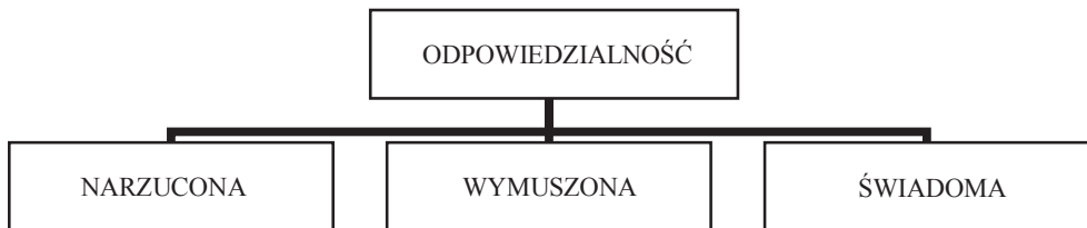
Rys. 3. Odpowiedzialność przedsiębiorstwa ze względu na przyczynę jej przyjmowania

Prawa człowieka np. muszą być przestrzegane nie tylko przez rządy i władze państwowe, ale i przez przedsiębiorstwa [Michalik 2003], a zwłaszcza – jak pisze P. Sane – przez „wielkie ponadnarodowe korporacje, które mają coraz więcej władzy, coraz mocniej kształtują warunki naszego życia i dlatego muszą ponosić coraz większą odpowiedzialność za swoje działania”.