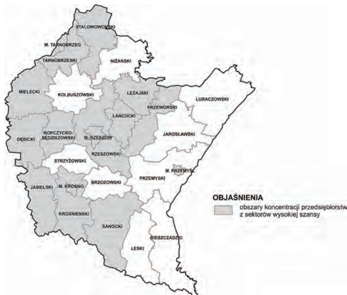
Rys. 1. Obszar strategicznej interwencji dla kierunku 1.1.1

Nowym elementem jest także terytorializacja kierunków działania, czego przykładem jest rys. 1, ilustrujący obszar strategicznej interwencji dla kierunku 1.1.1.