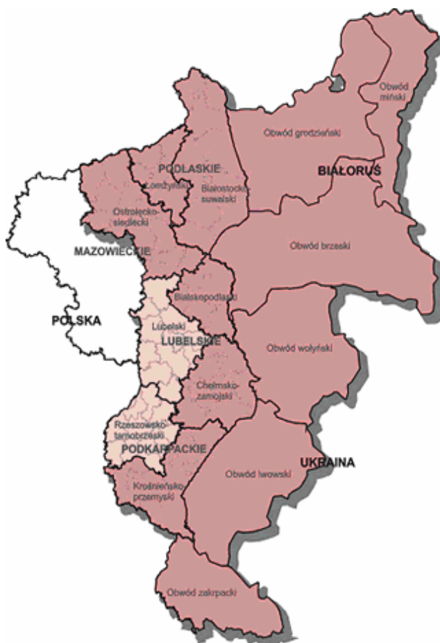
Rys. 2. Zasięg terytorialny Programu Sąsiedztwa Polska–Białoruś–Ukraina INTERREG IIIA/TACIS CBC

kiego, krośnieńsko-przemyskiego oraz ostrołęcko-siedleckiego. Na Białorusi są to obwody grodzieński i brzeski oraz zachodnia część obwodu mińskiego. Na Ukrainie obwody wołyński, lwowski i zakarpcki.