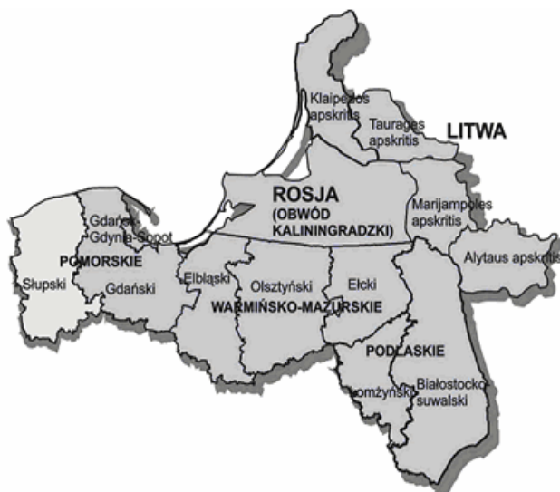
Rys. 3. Zasięg terytorialny Programu Sąsiedztwa Polska–Litwa–Federacja Rosyjska (obwód kaliningradzki) INTERREG IIIA/TACIS CBC