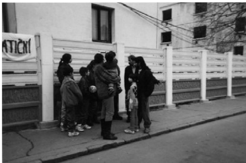
Fot. 1. Mur oddzielający ludność romską od ludności czeskiej w Usti nad Łabą