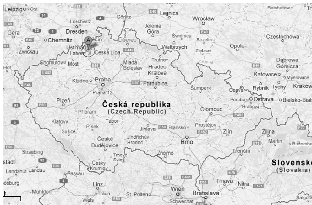
Rys. 1. Położenie Usti nad Łabą w Czechach

Usti nad Łabą, ósme co do wielkości miasto w Republice Czeskiej, jest stolicą kraju uesteckiego, jednego z czternastu regionów administracyjnych państwa. Region uesteckie leży w północno-zachodniej części Republiki Czeskiej i graniczy z Republiką Federalną Niemiec. Miasto usytuowane jest na zboczach Rudaw w głębokiej dolinie rzek Biliny i Łaby. Ze względu na swoje położenie i walory środowiska naturalnego miasto w 40% znajduje się w granicach obszarów chronionych 2 . Rysunek 1 ukazuje położenie Usti nad Łabą w Republice Czeskiej.