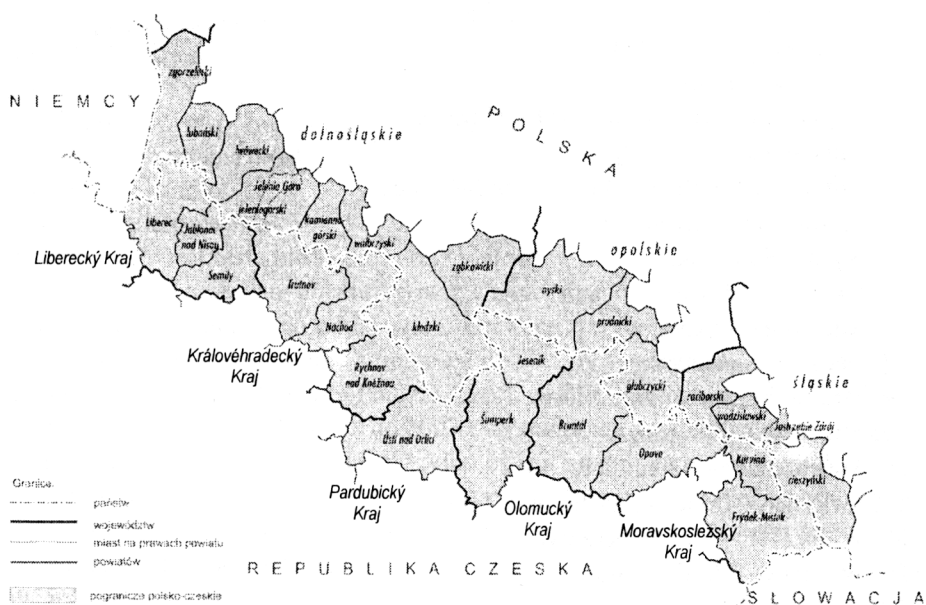
Rys. 1. Powiaty na pograniczu polsko-czeskim w 2005 r.