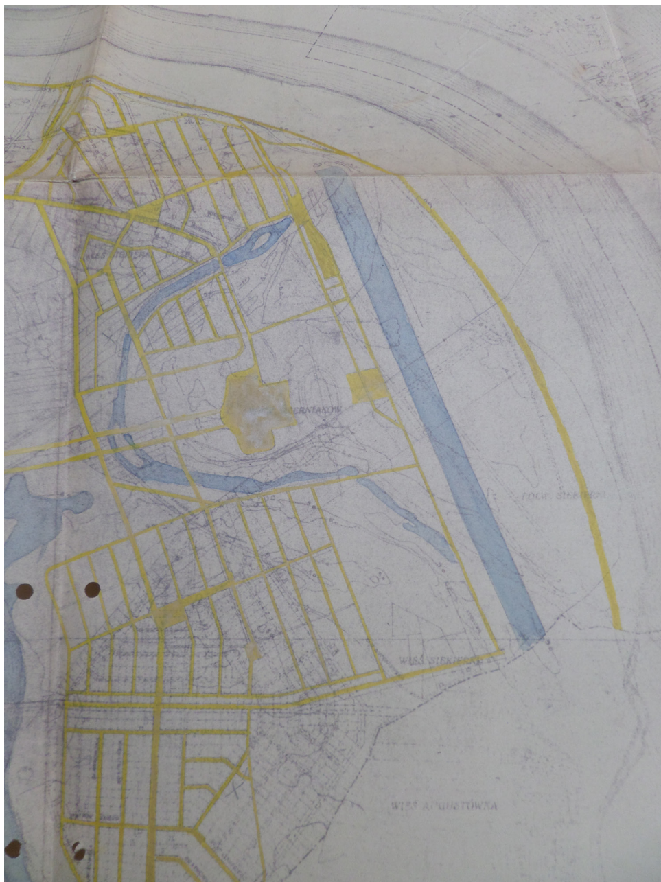
Rycina 4. Siekierki. Plan zabudowania w skali 1:10000. Schemat sieci komunikacyjnej.