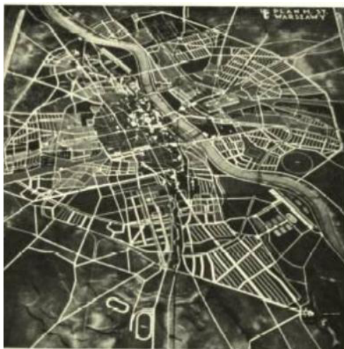
Rycina 6. Ogólny plan zagospodarowania przestrzennego Warszawy z 1931 r. W łuku Wisły w południowej części miasta widoczny tor regatowy i park sportowy. Dostrzec można również planowane lotnisko komunikacyjne na Gocławiu