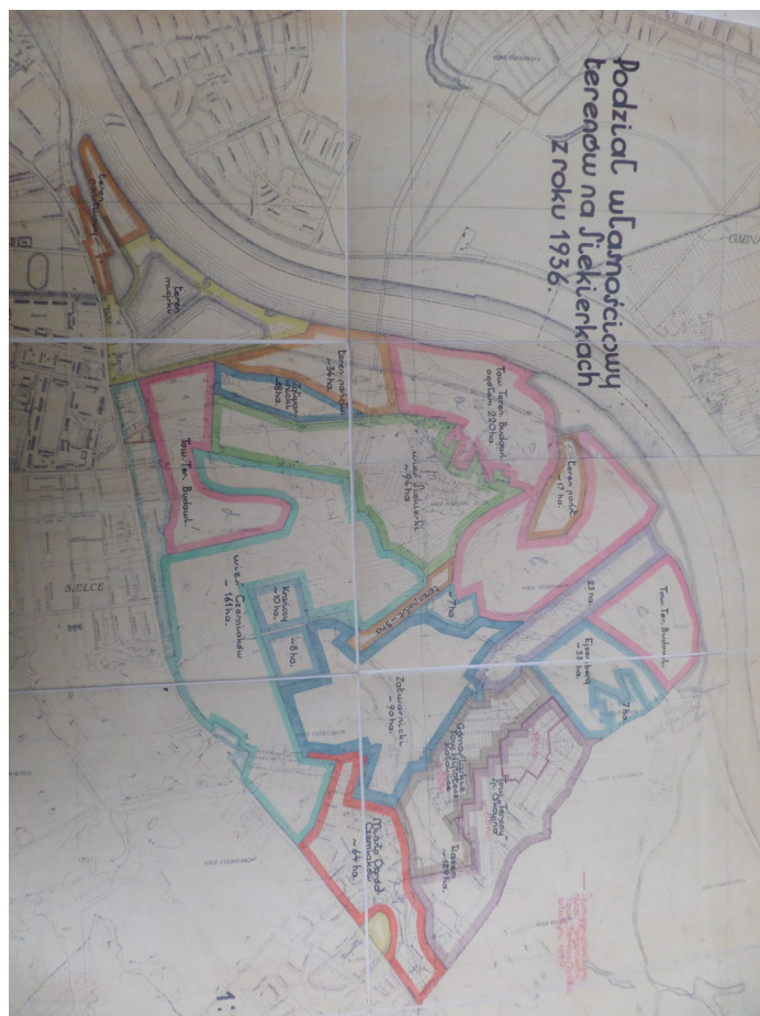
Rycina 1. Podział własnościowy terenów na Siekierkach, 1936.

racji Wioślarskiej (FISA) i mogłoby uniemożliwić organizację międzynarodowych zawodów na tak przygotowanym torze. Wskazywano też na bardziej prozaiczne problemy wynikające z takiego rozwiązania, argumentując, że spowoduje ono spadek frekwencji na trybunach toru (i dochodów z biletów wstępu na imprezy sportowe), gdyż publiczność, chcąc podziwiać i dopingować wioślarzy, będzie się gromadziła na wiadukcie trasy komunikacyjnej. Przedstawiciele PZTW wnioskowali o przesunięcie trasy na południe, poza obręb toru (APW, 3/8831, k. 11). Prośby te, pomimo początkowego oporu władz miasta (APW, 3/8907, k. 26) 8 , zostały uwzględnione i w planach z 1939 r. trasa Wawer-Raszyn była już wytyczona nieco dalej na południe i nie przecinała osi toru regatowego ani nie ingerowała przestrzennie w tereny sportowe o skali ogólnopolskiej i międzynarodowej (APW, 3/8840, k. 2) 9 .