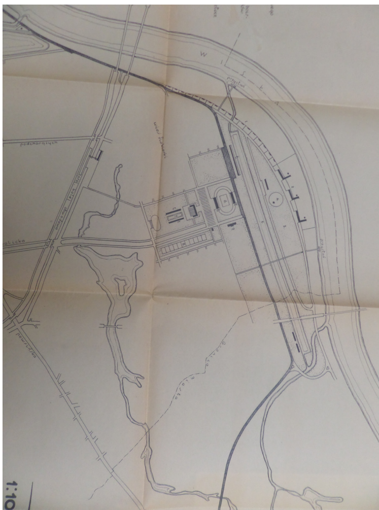
Rycina 5. Projekt terenów sportowych i bulwaru na Siekierkach.

miał być projektowany analogicznie do berlińskiego odpowiednika, można się domyślać, że byłyby to bardzo duży obiekt, mogący pomieścić nawet 100 000 widzów, z bieżnią lekkoatletyczną, ale bez toru kolarskiego. W jego sąsiedztwie planowano ulokować 50-metrową pływalnię otwartą, stadion tenisowy i kilkanaście kortów.