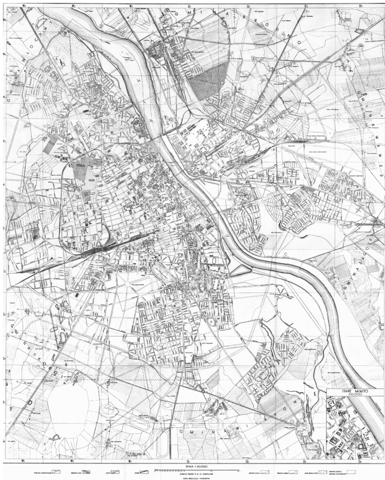
Rycina 7. Plan Warszawy z 1939 r. z zaznaczoną osią regatowego.