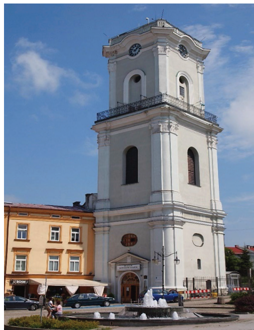
Fot. 20.6. Muzeum Dzwonów i Fajek w Wieży Zegarowej (stan z 21 lipca 2020 roku)

Muzeum Dzwonów i Fajek mieści się w późnobarokowej Wieży Zegarowej przy ulicy Władycze 3, blisko końca ulicy Franciszkańskiej i placu Niepodległości (fot. 20.6). 38-metrowa Wieża Zegarowa wybudowana była już po I rozbiórce – w latach 1775-