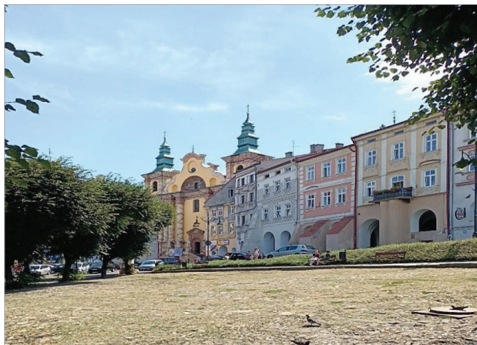
Fot. 20.5. Widok na południowo-wschodnią część Rynku (przed renowacją) oraz kościół Franciszkanów (stan z 16 sierpnia 2021 roku)

Photo 20.5. View of the south-eastern part of the Market Square (before renovation) and the Franciscan Church (as of August 16, 2021)