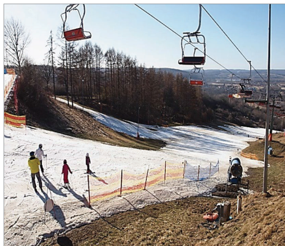
Fot. 20.9. Sztucznie naśnieżany stok narciarski (stan z 24 lutego 2022 roku) Photo 20.9. Artificially snowed ski slope (as of February 24, 2022)

W granicach Przemyśla znajduje się oddany do użytku w styczniu 2006 r. stok narciarski wraz z wyciągiem orczykowym (fot. 20.9). Obiekt obsługują dwie kolejki. Pierwsza kolejka KL 1 (dolna 2-osobowa) dowozi narciarzy z parkingu dolnego do podnóża stoku (kolejka ma długość 270 m i przepustowość 1050 osób na godzinę). Druga kolejka KL 2 (górna 3-osobowa) kursuje wzdłuż tras zjazdowych. Jej długość to 740 m, zaś przepustowość wynosi 1656 osób na godzinę (Przemyśl, 2019).