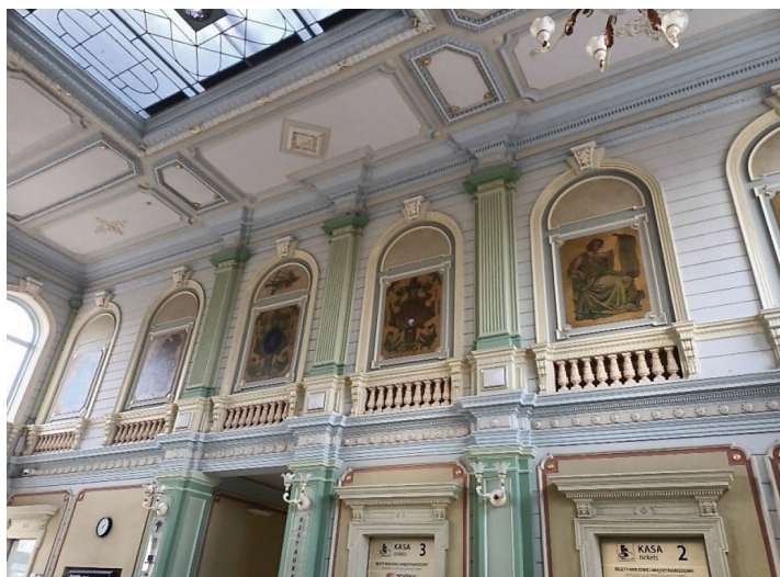
Fot. 20.7. Wnętrze dworca kolejowego (stan z 4 sierpnia 2021 roku)

Photo 20.7. Interior of the train station (as of August 4, 2021)