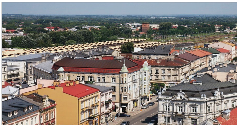
Fot. 20.11. Widok z Wieży Zegarowej w kierunku ulicy Mickiewicza i dworca kolejowego (stan z 21 lipca 2020 roku)

Photo 20.11. View from the Clock Tower towards Mickiewicz Street and the railway station (as of July 21, 2020)