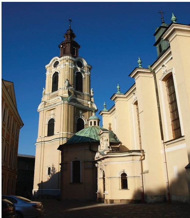
Fot. 20.2. Fragment budynku katedry rzymskokatolickiej wraz z wolnostojącą wieżą (stan z 24 lipca 2017 roku)

Photo 20.2. Fragment of the building of the Roman Catholic cathedral with a free-standing tower (as of July 24, 2017)