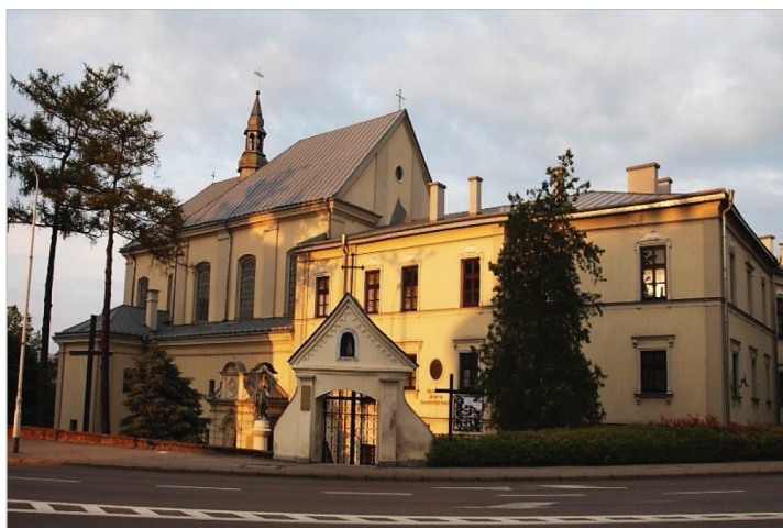
Fot. 20.10. Opactwo sióstr Benedyktynek (stan z 17 lipca 2020 roku)

Photo 20.10. Abbey of the Benedictine Sisters (as of July 17, 2020)