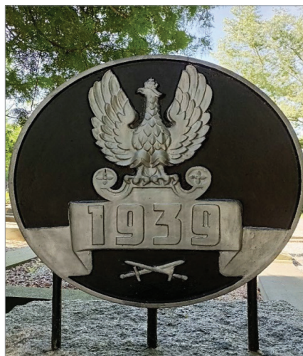
Fot. 20.12. Cmentarna kwatery polskich żołnierzy poległych we wrześniu 1939 roku (stan z 3 sierpnia 2021 roku)