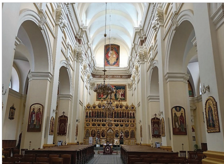
Fot. 20.3. Wnętrze katedry greckokatolickiej (stan z 30 lipca 2021 roku) Photo 20.3. Interior of the Greek Catholic Cathedral (as of July 30, 2021)