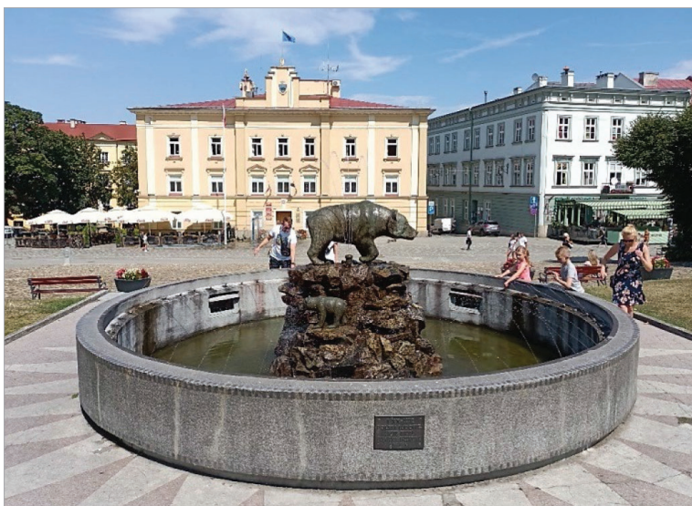
Fot. 20.4. Fontanna niedźwiedzicy z dwoma młodymi, na tle kamienicy pełniącej funkcję ratusza (stan z 16 sierpnia 2021 roku)

Photo 20.4. Bear fountain with two young bears against the background of the tenement house serving as the town hall (as of August 16, 2021)