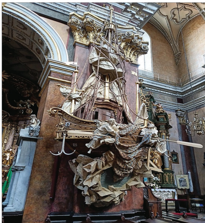
Fot. 20.8. Barokowa ambona w kształcie łodzi Piotrowej (stan z 30 lipca 2021 roku)