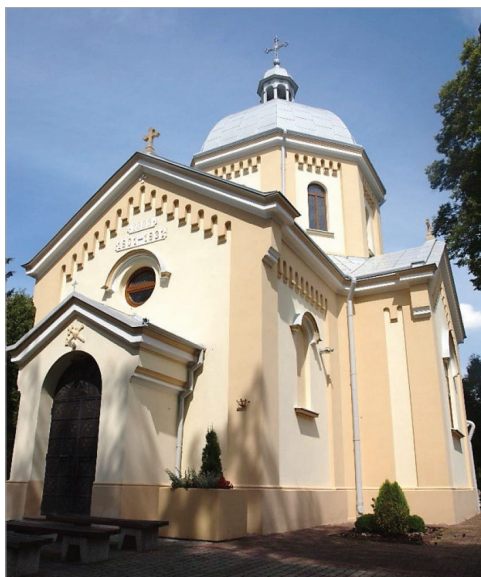
Fot. 20.13. Kościół rzymskokatolicki pod wezwaniem św. Jana Apostoła na przemyskiej Przekopanej – dawna cerkiew (stan z 24 lipca 2020 roku)

Photo 20.13. Roman Catholic Church of St. John the Apostle in Przemyśl-Przekopana – former Orthodox church (as of July 24, 2020)