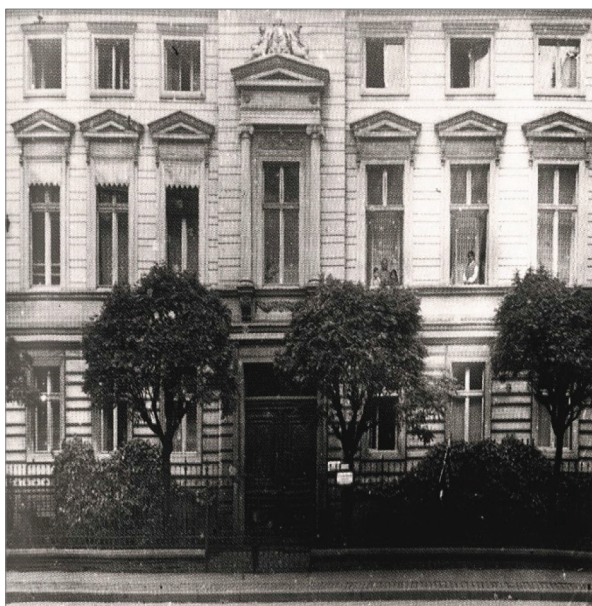
Fot. 14.1. Dom rodzinny Edyty Stein przy Michaelisstrasse 38 pod koniec lat 20. XX wieku

Kamienica została zbudowana około 1890 roku w stylu neoklasycystycznym. Jest to dwukondygnacyjny budynek murowany z cegły, wzniesiony w linii zabudowy ulicy, tynkowany, ozdobiony dekoracją architektoniczną (fot. 14.1). Do lat 30. przed domem znajdował się ogródek z krzewami i kulistymi akacjami, oddzielony od chodnika żelaznym płotem (Internet 3).