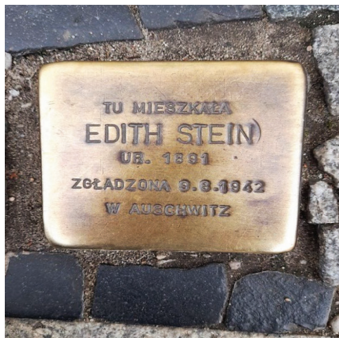
Fot. 14.3. „Kamień pamięci” przed domem rodzinnym Edyty Stein przy ul. Nowowiejskiej 38 Photo 14.3. „Memory stone” in front of Edith Stein’s family home at Nowowiejska street 38

Od 2008 roku przed wejściem do Domu Edyty Stein znajduje się wmurowany w bruk miedziany stolperstein – „kamień pamięci”, w wolnym tłumaczeniu z języka niemieckiego oznaczający „kostkę brukową, o którą można się potknąć” (fot. 14.3). Pomysłodawcą tej formy upamiętnienia ofiar Holokaustu był niemiecki artysta Gunter Demnig. „Kamienie pamięci”, z wrytymi nazwiskami osób zamordowanych lub represjonowanych podczas II wojny światowej, umieszczane są w chodnikach przed dawnymi domami ofiar. Mają one przypominać o okrutnym losie ludzi, którzy żyli w tych miejscach, a zginęli tragicznie z rąk hitlerowców. Autor projektu powtarza słowa Talmudu, że pamięć o człowieku trwa, dopóki pamiętane jest jego imię. Dlatego właśnie stolperstein to sposób na wskrzeszenie pamięci o tych, którzy nie mają swoich grobów.