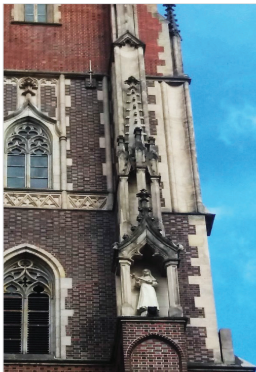
Fot. 14.9. Figura św. Edyty Stein na południowej wieży wrocławskiej katedry Photo 14.9. The figure of St. Edith Stein on the southern tower of the Wrocław Cathedral

Na południowej wieży wrocławskiej katedry w narożnej tablicy stoi figura św. Edyty Stein dłuta Mariana Lewczaka (fot. 14.9). Uroczyste poświęcenie rzeźby miało miejsce podczas mszy świętej 24 października 2009 roku.