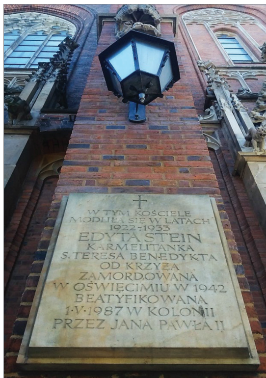
Fot. 14.6. Tablica pamiątkowa poświęcona św. Edycie Stein przy wejściu do kościoła św. Michała Archanioła przy ul. Prusa 78 Photo 14.6. Memorial plaque dedicated to St. Edith Stein at the entrance to the Church of St. Michael the Archangel at Prusa 78