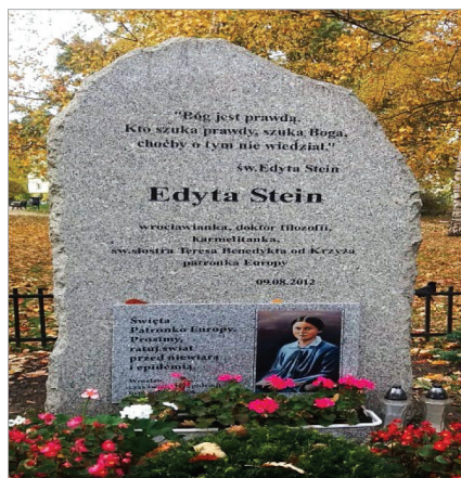
Fot. 14.5. Pomnik św. Edyty Stein w parku nazwanym jej imieniem Photo 14.5. Monument to Edith Stein in the Park named after Her

Pomnik poświęcony św. Edycie Stein został postawiony dnia 9 sierpnia 2012 r. u zbiegu ulic Kardynała Stefana Wyszyńskiego i Nowowiejskiej w siedemdziesiątą rocznicę jej śmierci (fot. 14.5). Na prostej steli wyryta jest myśl zagazowanej w Auschwitz-