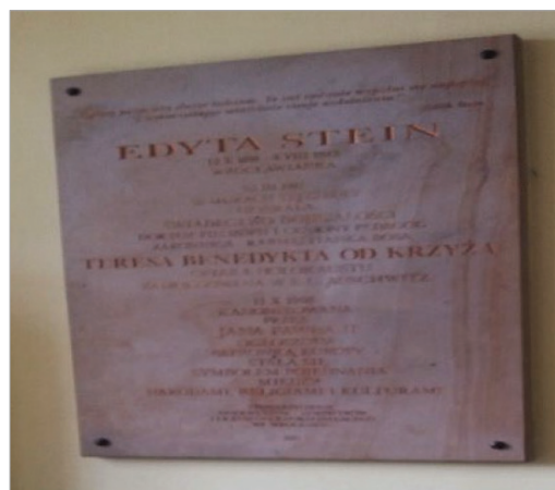
Fot. 14.4. Tablica poświęcona św. Edycie Stein w I LO przy ul. Poniatowskiego 9