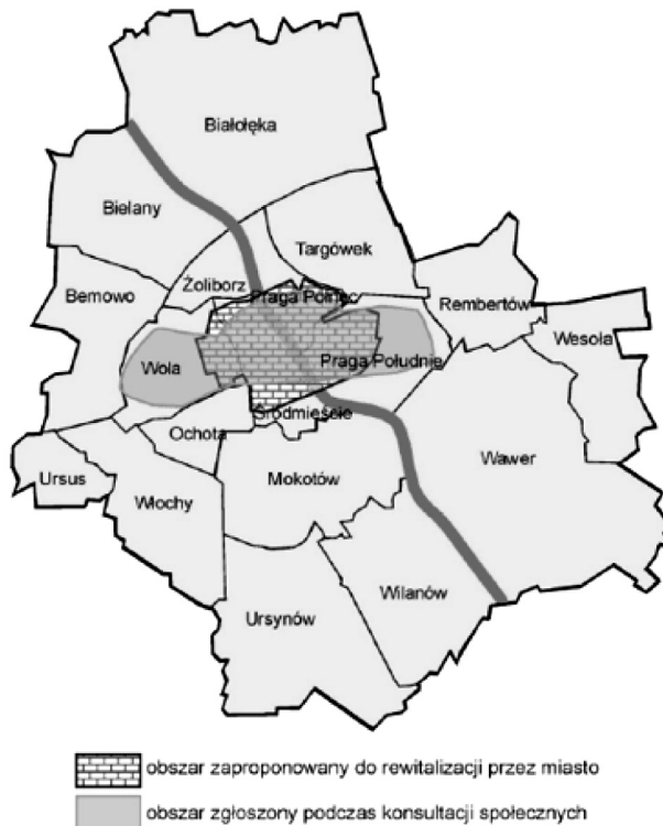
Rys. 3. Lokalizacja obszaru wyznaczonego do działań rewitalizacyjnych w LUPR m. st. Warszawy

W „Mikroprogramie Rewitalizacji Dzielnicy Praga-Północ” ujęto 10 projektów, z których 8 stanowiących kontynuację rozpoczętych w 2001 r. działań inwestycyjnych związanych z rewitalizacją ulicy Żąbkowskiej zaakceptowała Komisja.