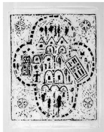
5. Estampage, 110 × 90 cm, gipsoryt na papierze ryżowym zbiory Muzeum Papiernictwa, sygn. MD6607A