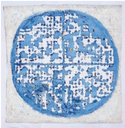
2. Duże koło niebieskie, średnica 180 cm, papier, klej, nici, farba olejna, zbiory Artysty