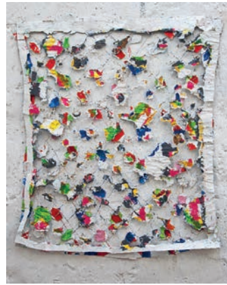
3. Z kobierca , 65 × 55 cm, papier, klej, nici, farba olejna, zbiory Artysty

Na wystawie w Muzeum pokaza- no 30 prac z lat 1980-2018. Dzieła te prezentowały najbardziej charaktery- styczne fazy w twórczości Edwarda Barana. Oprócz obrazów pojawiły się grafiki, gipsoryty na papierze japoń- skim oraz monotypie.