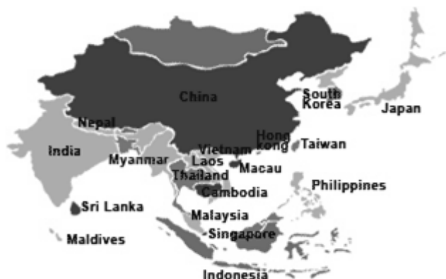
Rys. 1. Układ przestrzenny Macau na tle Azji

Nazwa Macau (Macao) wywodzi się od popularnej wśród żeglarzy i rybaków chińskiej bogini znanej jako A-Ma lub Ling Ma. Pierwotnie był to obszar składający się z typowych wiosek rybackich. W roku 1557 Chiny wydzierżawiły go Portugalii. W 1887 roku Macau stało się już portugalską kolonią. W latach 1951-1976 posiadało status prowincji zamorskiej, by następnie przejść na status portugalskiego terytorium specjalnego, którym to obszarem zarządzał gubernator. Od 1999 roku ponownie jest w granicach ChRL. Położenie geograficzne przedstawia mapa 1.