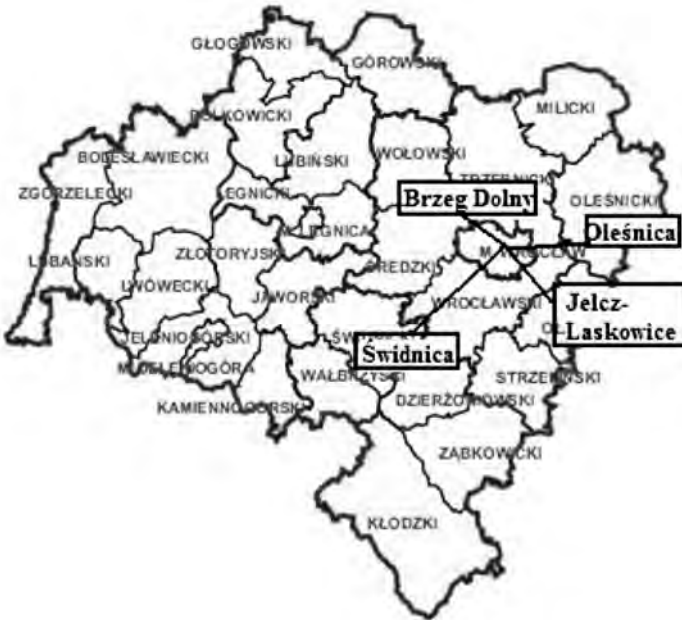
Rys. 1. Położenie geograficzne badanych gmin względem Wrocławia

Badaniem objęto wybrane gminy województwa dolnośląskiego i zarazem aglomeracji wrocławskiej: Świdnicę (gmina miejska), Jelcz-Laskowice (gmina miejsko-wiejska), Oleśnicę (gmina miejska) i Brzeg Dolny (gmina miejsko-wiejska). Były to gminy o wysokiej dynamice rozwoju, o znaczącej pozycji w skali województwa. Gminy te analizowano w zakresie ogólnych parametrów określających ich kondycję społeczno-ekonomiczną oraz specjalizacji działalności gospodarczej, ze szczególnym uwzględnieniem mikroprzedsiębiorców w gospodarce wskazanych jednostek terytorialnych. Potencjał endogeniczny badano, bazując szczególnie na: zasobach ludzkich, specyficznych walorach gmin, jakości życia oraz przewagach funkcjonalnych w zakresie działalności gospodarczej.