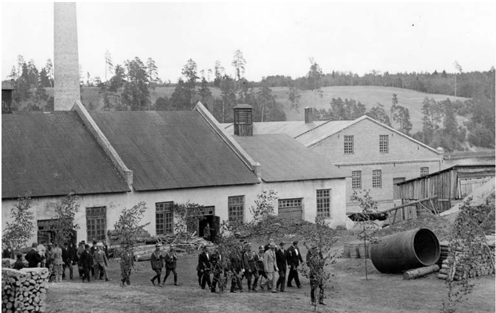
Wizyta prezydenta RP Ignacego Mościckiego w papierni w Grzegorzewie