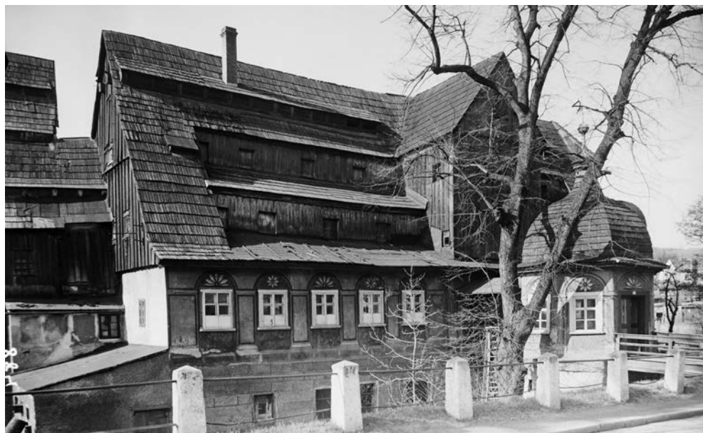
2. Oryginal fotografii młyna papierniczego z okresu międzywojennego, obecnie negatyw w zbiorach Muzeum Filumenistycznego w Bystrzycy Kłodzkiej