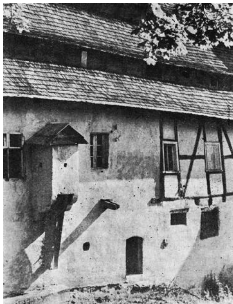
4. Fragment południowej ściany młyna papierniczego, fot. zamieszczona w książce A. Koźmińskiego, Duszniki Zdrój i okolice , Warszawa 1960, s. 5.