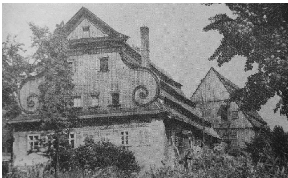
5. Młyn papierniczy od strony zachodniej, fot. A. Nitscha zamieszczona w książce W. Walczaka, Ziemia Kłodzka. Monografia krajoznawcza , Warszawa 1956, s. 109.