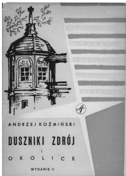
3. Okładka książki „Duszniki Zdrój i okolice” A. Koźmińskiego, wydanej w 1960 r., egzemplarz w zbiorach Muzeum Papiernictwa.