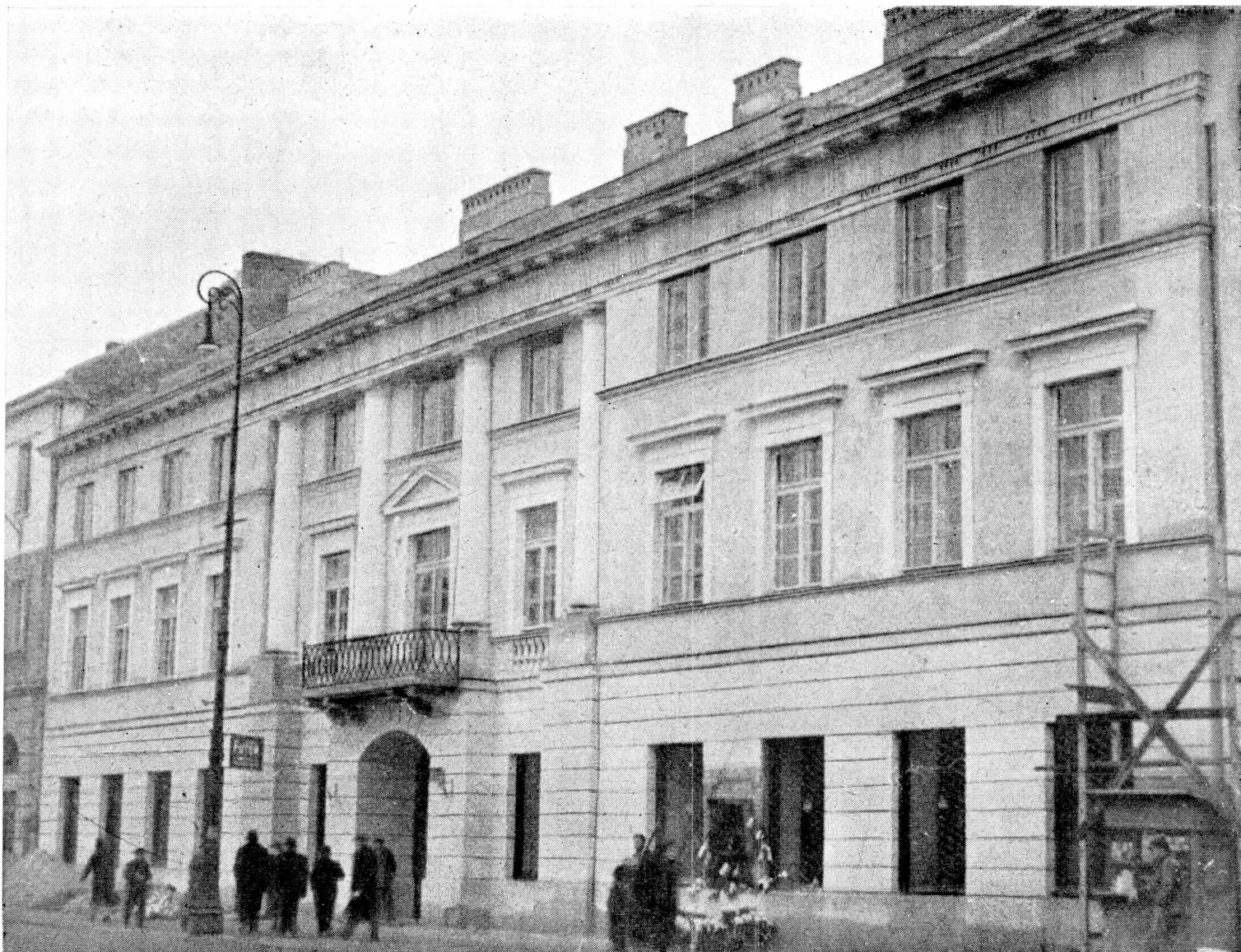
Dom Ekonomistów Polskich im. Ludwika Krzywickiego