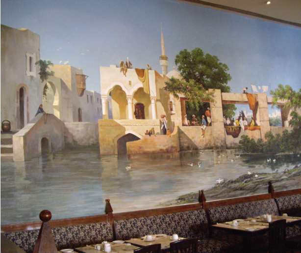
Il. 3. Fragment dekoracji w hotelu „Le Meridien”, Makadi Bay, Egipt (fot. E. Świącka, 2008)

Fig. 3. Fragment of decorations in “Le Meridien” hotel, Makadi Bay, Egypt (photo by E. Świącka, 2008)