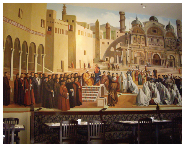
Il. 2. Dekoracje hotelu „Le Meridien”, Makadi Bay, Egipt

Emotionally – they bring some life to the monotonous views of the desert around the hotel. They are admired and recognized, and at the same time they confirm the conviction of the hotel guests that in spite of being far away from the original pyramids they are in the country where they used to be built centuries ago.