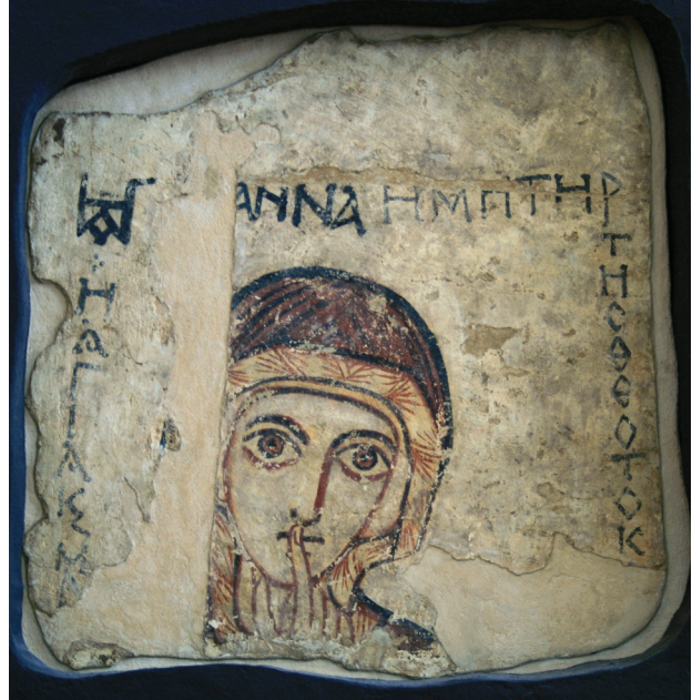
Il. 4. Św. Anna w Galerii Faras

W często przywoływanym artykule Aloisa Riegla o kulcie zabytków, wśród omawianych przez niego wartości autentyczności nie było; pojęcie to pojawiło się jedynie w kontekście badań historycznych [7, s. 199]. Autentyczność zabytku stanowił warunek sine qua non jakichkolwiek poważnych rozważań i badań sztuki oraz architektury. Sto lat temu były inne czasy. Śluby i przysięgi składane na całe życie były znacznie częściej dotrzymywane, banki z całą odpowiedzialnością stały na straży powierzonych walorów, a ci, którzy cokolwiek wytwarzali, starali się, aby opinia o ich pracach była możliwie najlepsza, dzieło zaś czy wyrób jak najdoskonalszy i najtrwalszy. Nie będę opisywać dzisiejszego świata, który „jaki jest, każdy widzi”, ale docierające do nas codzienne wiadomości o podróbkach, fałszerstwach, oszustwach i nadużyciach bardzo inspirowały do rozważań o autentyczności. Dlatego pojęcie to tak często powraca jako temat przewodni rozmaitych seminariów i konferencji, fascynuje nieustannie badaczy na całym świecie. Także i na nas spoczywa zadanie stałego definiowania jego istoty.