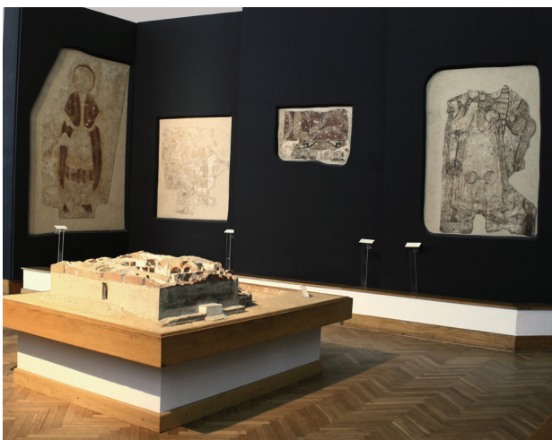
Il. 1. Galeria Faras, Muzeum Narodowe w Warszawie

Pierwszy przykład (il. 1) to unikatowa kolekcja wczesnochrześcijańskich nubijskich fresków ze świątyni w Faras, eksponowana w Muzeum Narodowym w Warszawie. Już na początku należy zwrócić uwagę na różni-