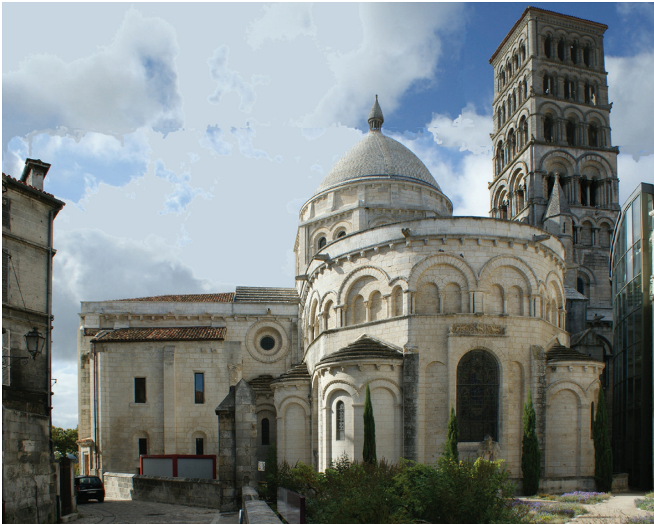
Il. 1. Część wschodnia katedry, 2012