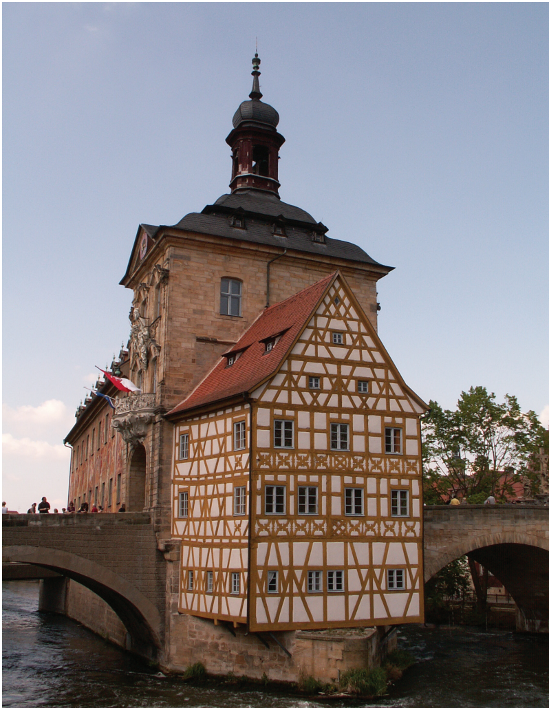
Stary Ratusz w Bambergu wybudowany na wyspie na rzece Regnitz

Altes Rathaus (Old Town Hall) in Bamberg built on an island of the Regnitz river