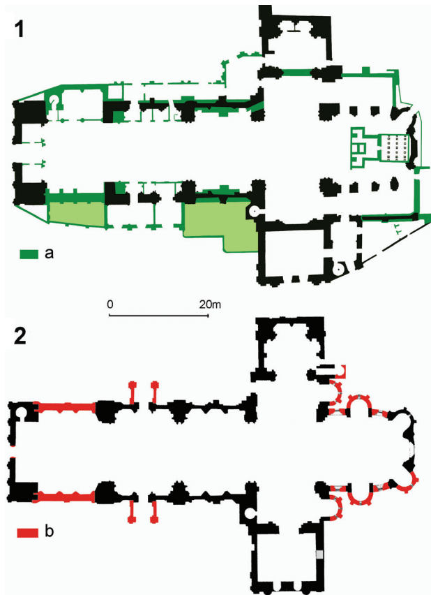
Il. 2. Rzut katedry: 1 – 1826 r., przerys według [10, il. XIV], a – mury rozebrane około 1850 r.; 2 – 1870 r. [1, s. 10], b – mury zbudowane w latach 1850–1870