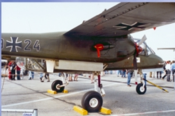
Przyjacielskie czarne krzyże