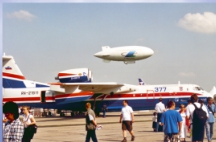
Łódź latająca Beriewa, ze sterowcem w tle