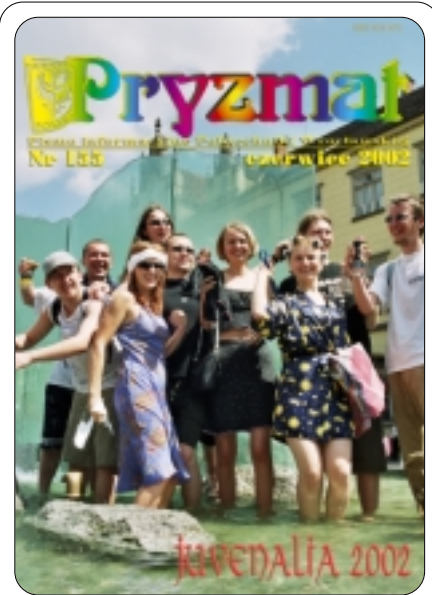
Relaks na kąpielisku Rynek Zdrój