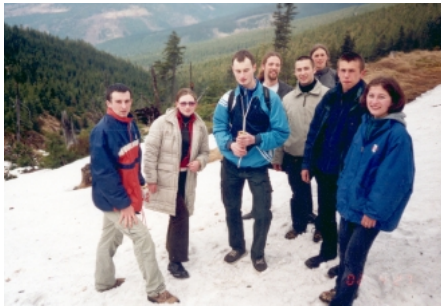
Grupa studentów na trasie „szlak by trafił”