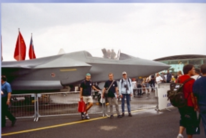
Nasi przy makiecie J.F.S.