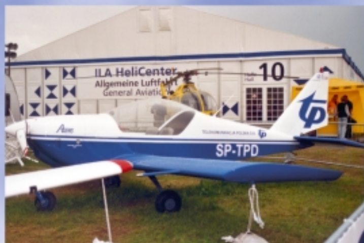
AT-3 Antoniewskiego – absolwenta Politechniki Warszawskiej