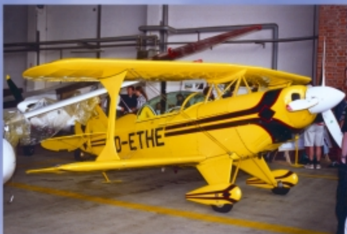
Wiecznie młody „Pitt Special” (dwupłatowa akrobatka)