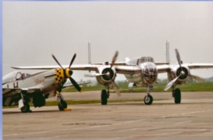
Oldtimery na start! P51 i B52 z 1944 r. Na nich latali Polacy w Anglii.